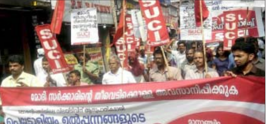
പെട്രോളിയം ഉൽപ്പന്നങ്ങളുടെ വില കുറയ്ക്കണമെന്നാവശ്യപ്പെട്ട് കോഴിക്കോട് നഗരത്തിൽ എസ്.യു.സി.ഐ. (കമ്മ്യൂണിസ്റ്റ്) നടത്തിയ പ്രതിഷേധ പ്രകടനം

മാണ് ഭരണാധികാരികൾ അനുവർത്തിച്ചിരുന്നത്. എണ്ണക്കമ്പനികൾ നേരിയ വിലക്കുറവ് വരുത്തുമ്പോൾ തീരുവകൾ വർദ്ധിപ്പിച്ച് സർക്കാർ അതുപോലും കൊള്ളയടിക്കുന്നു. അസംസ്കൃത എണ്ണയുടെ വില, റിഫൈനിംഗ് ചാർജ്ജ്, പെട്രോളിയം കമ്പനികളുടെ കൊള്ളലാഭം, വിതരണക്കാരുടെ കമ്മീഷൻ എന്നിവയെല്ലാം ചേർന്നുള്ള പെട്രോളിന്റെ ഇന്നത്തെ യഥാർത്ഥവില ലിറ്ററിന് 28 രൂപ മാത്രമാണ്. വിപണിയിലെ 63 രൂപയും. 35 രൂപ കേന്ദ്ര-സംസ്ഥാന സർക്കാരുകളുടെ നികുതിയാണ്. ഉൽപ്പന്നത്തിന്റെ വിലയേക്കാൾ അധികമാണ് നികുതി. പാകിസ്ഥാൻ, ശ്രീലങ്കയടക്കമുള്ള രാജ്യങ്ങളിൽപ്പോലും പെട്രോൾ വില ഇന്ത്യയേക്കാൾ കുറവാണ്. വളരെ കുറഞ്ഞവിലയ്ക്ക് ക്രൂഡ് ഓയിൽ ഇറക്കുമതി ചെയ്ത് ചുരുങ്ങിയ ചെലവിൽ ഇന്ത്യയിൽ ശുദ്ധീകരിച്ച് വൻവിലയ്ക്ക് വില്പന നടത്തുന്ന റിലയൻസ് പോലുള്ള കമ്പനികൾ ഇന്ന് ലാഭം കുന്നുകൂട്ടുകയാണ്. പെട്രോളിയം ഉൽപ്പന്നങ്ങളുടെ വില കുറച്ചാൽ അതുവഴി ചരക്കു കടത്തുകൂലിയും യാത്രക്കൂലിയും നിത്യോപയോഗ സാധനവിലയും കുറച്ച് ജനങ്ങൾക്ക് ആശ്വാസം നൽകാമെന്നിരിക്കെയാണ് കേന്ദ്രസർക്കാർ ഈ കഴുത്തറുപ്പൻ നിലപാട് സ്വീകരിച്ചിരിക്കുന്നത്. ബിജെപി