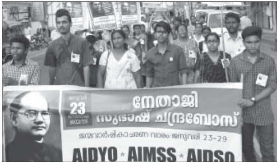
നേതാജി ജയന്തിയോടനുബന്ധിച്ച് ചങ്ങനാശേരിയിൽ നടന്ന പ്രകടനം

“സ്വാതന്ത്ര്യ സമരപ്രസ്ഥാനത്തിൽ യഥാർത്ഥ മതേതര ജനാധിപത്യ മുല്യങ്ങൾ