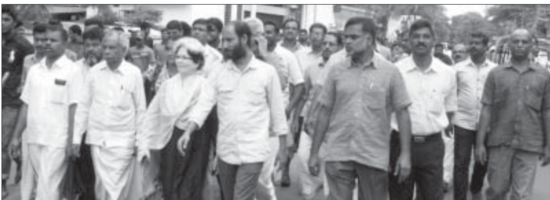
ദേശീയപാത സമരത്തിനെതിരെ നടന്ന പോലീസ് അതിക്രമങ്ങളെക്കുറിച്ച് അന്വേഷിക്കുന്നതിനായി പ്രശസ്ത സാഹിത്യകാരി സാറാ ജോസഫിന്റെ നേതൃത്വത്തിലുള്ള സംഘം സമരമേഖലകൾ സന്ദർശിക്കുന്നു.

രം വികസനം നടപ്പിലാക്കുന്നതിനെ തടയണമെന്നും സ്ഥലം ഏറ്റെടുക്കലിനെതിരെ പറച്ചിലു പ്രവർത്തിയാണ് വേണ്ടതെന്നും ശ്രീമതി സാറാ ജോസഫ് പറഞ്ഞു. സന്ദർശനശേഷം സ്വന്തം അഭിപ്രായങ്ങൾ മുഖ്യമന്ത്രിക്കും പ്രതിപക്ഷ നേതാവിനും ഫാക്സ് ചെയ്ത ശേഷമാണ് അവർ തിരിച്ചു പോയത്. വേദിനിന്നു നന്നവന്റെ നെഞ്ചിടിപ്പ് കേൾക്കാൻ ജനാധിപത്യ സംവിധാനത്തിന് നിലനിൽപ്പില്ലെന്ന് അവർ പറഞ്ഞു. എല്ലാം നഷ്ടപ്പെടുന്ന സ്ത്രീകളടക്കമുള്ളവരുടെ വേദന ഭരണാധികാരികൾ കാണേണ്ടതുണ്ട്. 45 മീറ്റർ ബി.ഒ.ടിപാതയാക്കുന്നതിൽ പതിനാലുപേർ ആളുകളെ കുടിയൊഴിപ്പിക്കേണ്ടിവരുന്നുണ്ട്. സ്ഥലമുള്ളവർക്കു നേതൃത്വം കാണുവാൻ ഞങ്ങളെ അനുവദിച്ചില്ല. പുനരധിവാസവും നഷ്ടപരിഹാരവും പോലും തീരുമാനിക്കാത്ത ഭൂസർവ്വേ നിർത്തിവെയ്ക്കണമെന്നും അവർ നിവേദനത്തിൽ ആവശ്യപ്പെട്ടു.