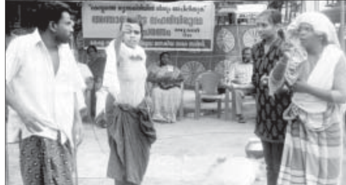
ലഹരിവിരുദ്ധ ദിനാചരണത്തിന്റെ ഭാഗമായി അമ്പലപ്പുഴയിൽ നടന്ന തൈരുവുനാടകത്തിൽ നിന്നും ഒരു ദൃശ്യം