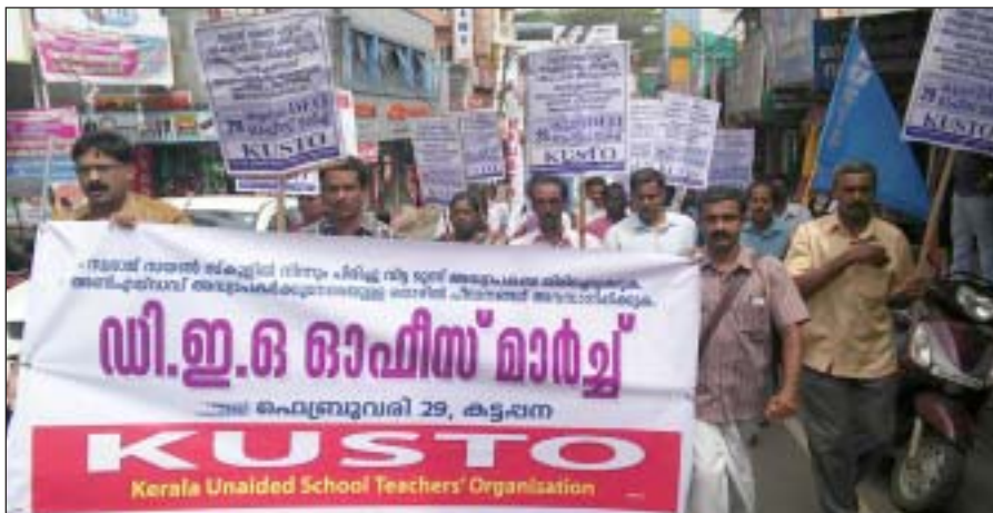
കെയുഎസ്റ്റിഒ കട്ടപ്പനയിൽ സംഘടിപ്പിച്ച ഡിഇഒ ഓഫീസ് മാർച്ച്