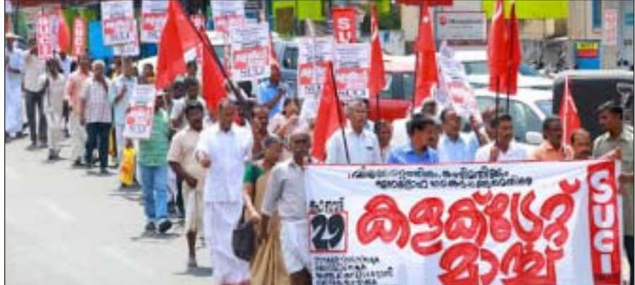
കൊല്ലം കളക്ട്രേറ്റ് മാർച്ച്