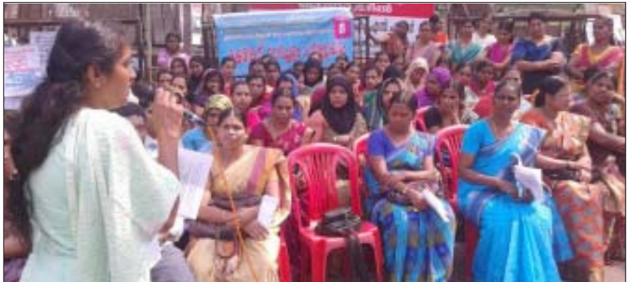
കളക്ട്രേറ്റ്മാർച്ച് കെ.എം.ബീവി ഉദ്ഘാടനം ചെയ്യുന്നു

എയ്ഡഡ് സ്കൂളുകളിലെ പ്രീപ്രെമറി അദ്ധ്യാപകർക്കും ആയമാർക്കും സർക്കാർ സർവീസിന് തുല്യമായ ശമ്പളവും മറ്റാനുകൂല്യങ്ങളും അനുവദിക്കുക, പ്രീപ്രെമറിയെ എയ്ഡഡ് സ്കൂളുകളുടെ ഭാഗമാക്കുക എന്നീ ആവശ്യങ്ങളുന്നയിച്ച് കോഴിക്കോട് കളക്ട്രേറ്റിലേക്ക് നടന്ന മാർച്ച് കെ.എം.ബീവി (സ്ത്രീസുരക്ഷാസമിതി)