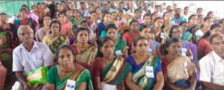
ജില്ലാ കൺവൻഷൻ സദസ്സിന്റെ ദൃശ്യം