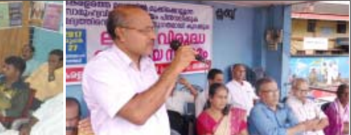
സുൽത്താൻബത്തേരിയിൽ ലഹരിവിരുദ്ധ സംഗമം