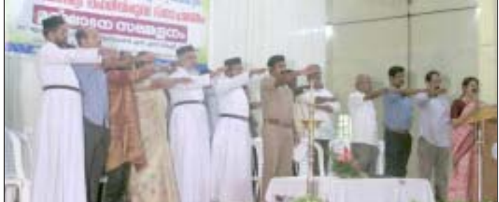
മുളന്തുരുത്തിയിൽ വെട്ടിക്കൽ സ്കൂളിൽ നടന്ന ലഹരിവിരുദ്ധ മാസാചരണ സമ്മേളനത്തിൽ ലഹരിവിരുദ്ധ പ്രതിജ്ഞയെടുക്കുന്നു