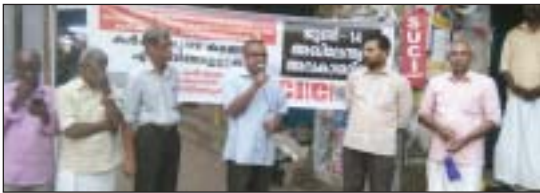
അവിലേന്ത്യാ അവകാശദിനാചരണത്തിന്റെ ഭാഗമായി ആലുവയിൽ നടന്ന യോഗം

ഡിമാന്റുകൾ നേടിയെടുക്കുന്നതിനായി സംഘടിതവും ശക്തവും നീണ്ടുനിൽക്കുന്നതും സുചിന്തിതവുമായ പ്രക്ഷോഭം വളർത്തിയെടുക്കണമെന്നും പൊരുതുന്ന കർഷകരോട് പാർട്ടി ആഹ്വാനം ചെയ്യുകയുമുണ്ടായി.