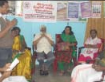
ഇടുക്കി ചെറുതോണിയിൽ ലഹരിവിരുദ്ധദിനാചരണം