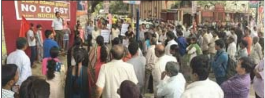
ബാംഗ്ലൂരിൽ നടന്ന ജിഎസ്ടി വിരുദ്ധ പ്രതിഷേധയാലി

വാദമെന്തെന്നാൽ, ഉപഭോഗത്തിനുമേലുള്ള നികുതിയാണ് ഉൽപാദനത്തിനുമേൽ നികുതി ചുമത്തുന്നതിലും ബുദ്ധിപരം. കാരണം ഒരു വ്യക്തി സ്വയമേവയാണ് ഒരു ഉൽപ്പന്നമോ സേവനമോ വാങ്ങി ഉപയോഗിക്കുന്നത്. അതുകൊണ്ടു തന്നെ നികുതി അടക്കേണ്ടതുണ്ട്. അവർ അഭിപ്രായപ്പെടുന്നത്, വരുമാനനികുതിയിലോ പ്രത്യക്ഷനികുതികളിലോ, ഒരാൾ സമ്പാദിക്കുന്നോ ചെലവാക്കുന്നോ എന്നു നോക്കാതെ അയാളെ ശിക്ഷിക്കുകയാണ്. എന്നാൽ ഉപഭോഗത്തിൽ ഊന്നിയ ആശയത്തിൽ, ഒരാൾക്ക് അയാളുടെ താല്പര്യത്തിൽ ചെയ്യുന്ന ഉപഭോഗത്തിന്റെ അടിസ്ഥാനത്തിലുള്ള നികുതി മാത്രമേ ഉണ്ടാകുന്നുള്ളൂ. ഇതാണ് ഈ നിർദ്ദേശത്തിന്റെ മർമ്മഭാഗം. പരമാവധി ലാഭം നേടാനായി, ചരക്കുകളോ സേവനങ്ങളോ ഉൽപാദിപ്പിക്കുന്ന ഒരു മുതലാളിത്ത ഉൽപാദകനെയോ നിക്ഷേപകനെയോ ശിക്ഷിക്കാൻ പാടില്ല. എന്നാൽ ജീവൻ നിലനിർത്തുന്നതിനായാൽ പോലും, ഉപഭോഗം നടത്തുന്ന സാധാരണക്കാരനെ ശിക്ഷിക്കാൻ മരണാസന്നമായ ഇന്നത്തെ മുതലാളിത്തത്തിന്റെ ബുർഷ്യാ സാമ്പത്തികശാസ്ത്ര നിഘണ്ടുവിൽ മാത്രം കാണാൻ കഴിയുന്ന, കപടമായ വാദഗതികളെ പിന്തുണക്കുവാനായി ഒരു ബ്ലോഗർ ഇന്റർനെറ്റിൽ നൽകിയ, സെൽഫോണുകളുടെ വിൽപ്പനയെ അടിസ്ഥാനമാക്കിയ രണ്ട് താരതമ്യ പട്ടികകൾ പരിശോധിച്ചപ്പോൾ, ജിഎസ്ടിക്ക് കീഴിലാണ് വിതരണക്കാരൻ കൂടുതൽ ലാഭം ഉണ്ടാക്കുന്നതെന്ന് കാണാൻ കഴിഞ്ഞു. ജിഎസ്ടിയിൽ ബില്ലോടു കൂടിയ വിൽപ്പനവില 17400 രൂപയും ജിഎസ്ടിക്ക് പുറത്ത് അത് 15600 രൂപയുമായിരുന്നു. ഇതുവഴി സാമാന്യബോധമുള്ള ഏതൊരാൾക്കും മനസ്സിലാകും കമ്പോളത്തിൽ നിന്നും വാങ്ങുന്ന ഒരു സാധാരണ ഉപഭോക്താവ് ഇവിടെ കൂടുതൽ വില നൽകേണ്ടി വരുമെന്ന്.