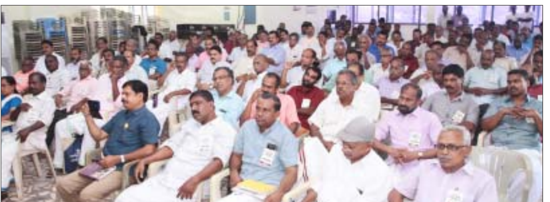
തൊടുപുഴയിലെ കർഷക സമ്മേളന സദസ്സ്

മാണെന്നും പാർലമെന്റ് പബ്ലിക് അക്കൗണ്ട് കമ്മിറ്റിയുടെ കണക്കുകളിൽ പറയുന്നു. മോദി സർക്കാരിന്റെ 3 സാമ്പത്തിക വർഷംകൊണ്ട് 1.91 ലക്ഷം കോടി രൂപയുടെ കോർപ്പറേറ്റ് കടങ്ങളാണ് എഴുതിത്തള്ളിയത്. ആരാണ് രാജ്യത്തിന്റെ സമ്പദ്വ്യവസ്ഥയെ തകർക്കുന്നതെന്നും, ആരാണ് മോശം വായ്പാസംസ്കാരം വളർത്തുന്നതെന്നും ഇതിൽനിന്നും വ്യക്തമാണ്. കർഷകോല്പന്നങ്ങൾക്ക് ഉല്പാദനച്ചെലവിന്റെ പത്തിലൊന്നു പോലും വിലകിട്ടാത്ത അവസ്ഥയുണ്ടാകുന്നു. വിത്ത്, വളം, കീടനാശിനി, വൈദ്യുതി, ഉല്പാദനോപകരണങ്ങൾ തുടങ്ങിയവയെല്ലാം വില കുത്തനെ കയറുകയും ചെയ്യുന്നു. കോർപ്പറേറ്റ് ഫാമിംഗും കോൺട്രാക്റ്റ് ഫാമിംഗും പോലുള്ള കോർപ്പറേറ്റ് കൊള്ളയ്ക്ക് കർഷകർ വിധേയരാകുന്നു. ജീവിക്കാൻ ഗതിയില്ലാതായ കർഷകർ സ്വന്തം ഭൂമിയിൽ കൃത്തകങ്ങളുടെ കുലിപ്പണിക്കാരായി ജോലി ചെയ്യേണ്ടി വരുന്നു. ലക്ഷക്കണക്കിന് കർഷകരാണ് കടുംബം പോറ്റാൻ മറ്റു സംസ്ഥാനങ്ങളിലേക്കും നഗരങ്ങളിലേക്കും കുടിയേറുന്നത്. നോട്ട് നിരോധനമെന്ന കാർപ്പറ്റ് ബോംബിംഗും ജി.എസ്.ടി യെന്ന നികുതിക്കുരുക്കും നടപ്പാക്കിയതോടെ രാജ്യത്തെ കർഷകരുടെയും കർഷകതൊഴിലാളികളുടെയും ജീവിതം എരിപിരി കൊള്ളുകയാണ്. രാഷ്ട്രീയ പ്രമേയം ചു