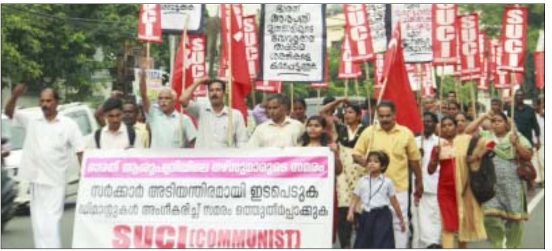
ഭാരത് ഹോസ്പിറ്റലിലെ നഴ്സുമാരുടെ സമരത്തിന് ഐക്യദാർഢ്യം പ്രകടിപ്പിച്ച് എസ്.യു.സി.ഐ(സി) ജില്ലാ കമ്മിറ്റിയുടെ ആഭിമുഖ്യത്തിൽ കോട്ടയം നഗരത്തിൽ നടത്തിയ പ്രകടനം

ജ്മെന്റിന് ഒപ്പമാണ് തങ്ങളെന്ന് പ്രഖ്യാപിച്ചു കഴിഞ്ഞു. സിഐറ്റിയുവിന്റെ നേതാക്കൾ പിന്തുണ അഭ്യർത്ഥിച്ചുചെന്ന നഴ്സുമാരെയും എൻ.എ ഉപേക്ഷിച്ച് സിഐറ്റിയുവിൽ ചേരണം എന്ന് ആവശ്യപ്പെട്ടുകൊണ്ട് അപമാനിക്കുക പോലും ചെയ്തു. ജോലി നഷ്ടപ്പെട്ട നഴ്സുമാർ പിന്തുണ അഭ്യർത്ഥിക്കുമ്പോൾ തികച്ചും സങ്കുചിതമായ സമീപനം പുലർത്തുന്ന സിഐറ്റിയു നേതാക്കൾ എന്ത് ഇടതുപക്ഷ രാഷ്ട്രീയമാണ് പ്രതിനിധാനം ചെയ്യുന്നത്? നഴ്സുമാരെ പിന്തുണയ്ക്കുവാൻ സന്നദ്ധമായിരുന്ന തിരുനെൽവേലിയിലെ ടാക്സി തിരുനെൽവേലിയിലെ ടാക്സി തൊഴിലാളിക്ക് അതിനുള്ള അനുവാദംപോലും സിഐറ്റിയു, ഐ.എൻ.ടി.യു.സി, ബി.എം.എസ് നേതാക്കൾ കൊടുത്തില്ല. ഈ സംഭവവികാസങ്ങളെല്ലാം സൂചിപ്പിക്കുന്നത് ഭാരത് ഹോസ്പിറ്റൽ മാനേജ്മെന്റുമായുള്ള പ്രമുഖ പാർട്ടികളുടെയും ട്രേഡ് യൂണിയൻ നേതാക്കൾമാരുടെയും അവിശ്വാസ ബന്ധത്തെയാണ്. സുപ്രീംകോടതി നിർദ്ദേശിച്ച ശമ്പളവർദ്ധനവ് ആവശ്യപ്പെട്ട് നഴ്സുമാർ സംസ്ഥാനവ്യാപകമായി നടത്തിയ പ്രക്ഷോഭത്തിലൂടെ തങ്ങളുടെ സംഘടിതശക്തി പ്രഖ്യാപിച്ചപ്പോൾ കേരള ജനത സർവ്വതർഫ്തത്തിലും അതിനെ പിന്തുണച്ചു. ആ സമരത്തിൽ പങ്കുചേരുകയും ഭാരത് ആശുപത്രിയിൽ യൂണൈറ്റഡ് നഴ്സസ് അസോസിയേഷന്റെ യൂണിറ്റ് രൂപീകരിക്കുകയും ചെയ്തതിനാണ് 58 നഴ്സുമാരെയും പി