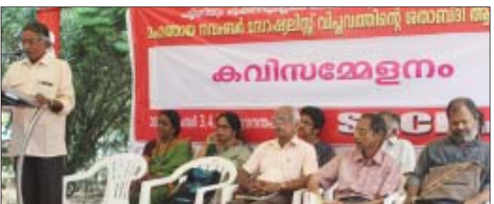
കവിസമ്മേളനം പ്രശസ്ത കവി ഡോ. ദേശമംഗലം രാമകൃഷ്ണൻ ഉദ്ഘാടനം ചെയ്യുന്നു