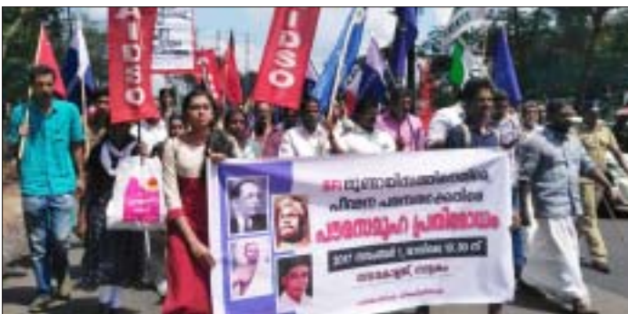
എസ്എഫ്ഐ അതിക്രമത്തിനെതിരെ നാട്ടകത്ത് നടന്ന പ്രതിഷേധ പ്രകടനത്തിന്റെ മുൻനിര