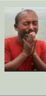
വളർന്നുവരുന്ന സാമ്രാജ്യത്വ ശക്തിയും മ്യാൻമറിനോട് ചേർന്നു കിടക്കുന്ന രാജ്യവുമായ ഇന്ത്യ ശ്രമിക്കുന്നതാകട്ടെ ചൈനയെ തള്ളിമാറ്റി സ്വന്തം സാധീനം വർദ്ധിപ്പിക്കാനാണ്. അതുകൊണ്ടാണ് അടുത്തിടെ മ്യാൻമർ സന്ദർശിച്ച ഇന്ത്യൻ പ്രധാനമന്ത്രി നരേന്ദ്രമോദി റോഹിംഗ്യകളുടെമേൽ നടക്കുന്ന ക്രൂരമായ അടിമർത്തലുകളെക്കുറിച്ച് ഒരക്ഷരംപോലും ഉരിയാടാതിരുന്നത്.