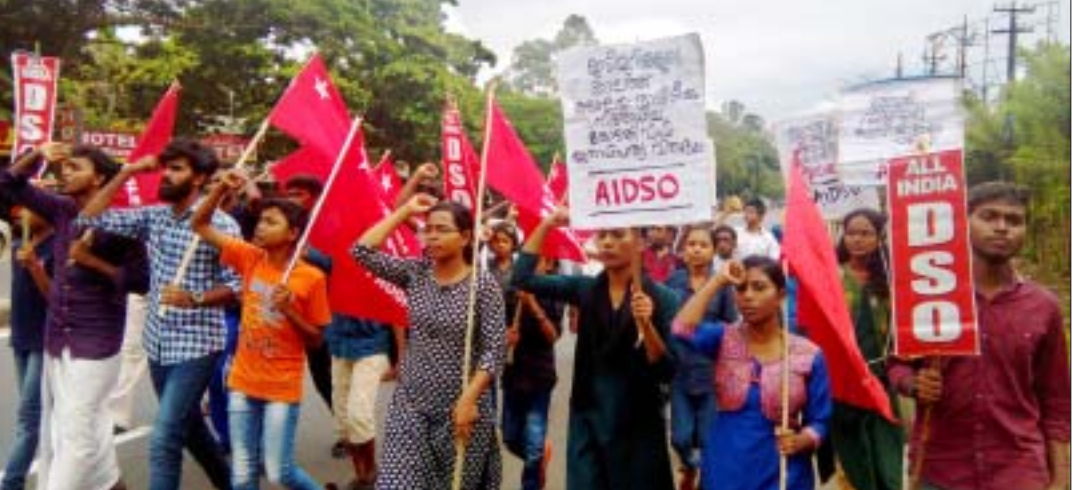
വിദ്യാർത്ഥി രാഷ്ട്രീയ നിരോധനത്തിനെതിരെ എഐഡിഎസ് അമ്പലപ്പുഴയിൽ നടത്തിയ പ്രകടനം

വിദ്യാർത്ഥിദ്രോഹ നടപടിയിലൂടെയും വിദ്യാഭ്യാസ വിരുദ്ധനയങ്ങളിലൂടെയും കൂപ്രസിദ്ധി ആർജ്ജിച്ച കെടിയു(കേരള ടെക്നിക്കൽ യൂണിവേഴ്സിറ്റി)വിനെതിരെ കേരളത്തിലെ എഞ്ചിനീയറിംഗ് വിദ്യാർത്ഥികൾ സമരരംഗത്താണ്. സമൂഹം നേരിടുന്ന നീറുന്ന പ്രശ്നങ്ങളിൽ ന്യായമായ മുദ്രവാക്യങ്ങളുയർത്തി സങ്കുചിത താൽപ്പര്യങ്ങൾക്ക് അതീതമായി സമരങ്ങൾ