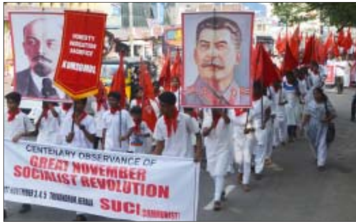
പ്രകടനത്തിന്റെ മുന്നിൽ കോസമോൾ മാർച്ച്