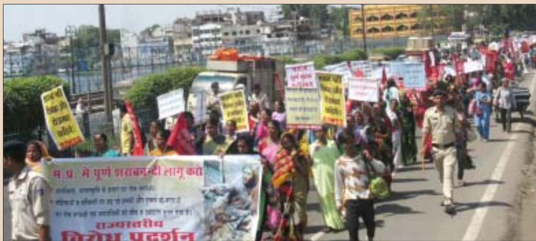
എഐഎംഎസ്എസിന്റെ നേതൃത്വത്തിൽ ഭോപ്പാലിൽ നടന്ന പ്രതിഷേധ റാലി

അമ്പതിനായിരത്തോളം പേർ ഒപ്പിട്ട നിവേദനം മുഖ്യമന്ത്രിയ്ക്ക് സമർപ്പിക്കുകയുണ്ടായി. മദ്യവും ലഹരി പദാർത്ഥങ്ങളും അശ്ലീലതയും വ്യാപിപ്പിച്ചുകൊണ്ട് യുവാക്ക