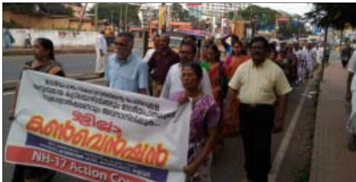
ജില്ലാ കൺവൻഷനു മുന്നോടിയായി കണ്ണൂർ ടൗണിൽ നടന്ന പ്രകടനം

പേരിൽ അന്യായമായി ഭൂമിയേറ്റെടുക്കുന്നതു വഴി ആയിരക്കണക്കിന് കുടുംബങ്ങളാണ് കുടിയൊഴിപ്പിക്കപ്പെടുന്നത്. 30 മീറ്ററിനുള്ളിൽ 4 വരിയായോ 6 വരിയായോ പാത നിർമ്മിച്ചാൽ കുടിയൊഴിപ്പിക്കൽ ഗണ്യമായി കുറയ്ക്കാനാകും. പൊതു ആവശ്യത്തിന് വേണ്ടി ഭൂമിയും കെട്ടിടങ്ങളും വിട്ടുകൊടുക്കുന്നവർക്ക് നിലവിലുണ്ടായിരുന്നതിനേക്കാൾ മെച്ചപ്പെട്ട നിലയിലുള്ള പുനഃരധിവാസവും മാർക്കറ്റ് വിലയും നൽകണം; ഇത് പൊതു ആവശ്യത്തിന് വേണ്ടി ഭൂമിയും കെട്ടിടങ്ങളും വിട്ടുകൊടുക്കാൻ ജനങ്ങളെ സ്വമേധയാ പ്രേരിപ്പിക്കുകയും ചെയ്യും. ഈ ആധുനിക വികസന സങ്കൽപം നമ്മുടെ ഭരണാധികാരികൾ അംഗീകരിക്കാൻ തയ്യാറല്ല. ജനങ്ങളെ തെരുവിലേക്ക് വലിച്ചെറിഞ്ഞുള്ള ഈ വികസന ഭ്രാന്തിനെ ഒരു കാരണവശാലും അംഗീകരിക്കാനാവില്ല. ഇതിനെതിരെ ശക്തമായി നിലകൊള്ളാനാണ് ജില്ലാ കൺവൻഷൻ തീരുമാനിച്ചിരിക്കുന്നത്. കുടിയൊ