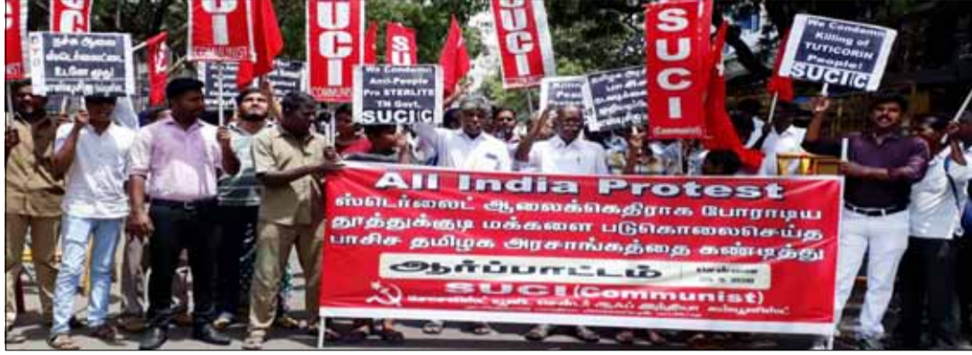
അഖിലേന്ത്യാ പ്രതിഷേധ ദിനാചരണത്തോടനുബന്ധിച്ച് ചെന്നൈ നഗരത്തിൽ നടന്ന പ്രതിഷേധ രാലി

തു ത്തുകൂടിയിൽ വേദാന്ത ഗ്രൂപ്പിന്റെ ഉടമസ്ഥതയിലുള്ള സ്റ്റേർലൈറ്റ് ചെമ്പ് ഫാക്ടറിയുടെ മലിനീകരണംകൊണ്ട് പൊറുതി മുട്ടിയപ്പോഴാണ് ആയിരക്കണക്കിന് ആളുകൾ മേയ് 22ന് തുത്തുകൂടി കളക്ട്രേറ്റിലേയ്ക്ക് മാർച്ച് ചെയ്തത്. മാർച്ച് തികച്ചും സമാധാനപരവും സുസംഘടിതവുമായിരുന്നു. മലിനീകരണ നിയന്ത്രണ നിയമങ്ങളോടൊക്കെ കാറ്റിൽ പറത്തി പ്രവർത്തിച്ചിരുന്ന കമ്പനിക്കെതിരെ തികച്ചും ന്യായമായ ഡിമാന്റാണ് ജനങ്ങൾ ഉയർത്തിയത്. എന്നാൽ അത് ചെവികൊള്ളാൻ വേദാന്ത ഗ്രൂപ്പിന് ഒത്താശ ചെയ്യുന്ന അധികാരികൾ തയ്യാറായിരുന്നില്ല.