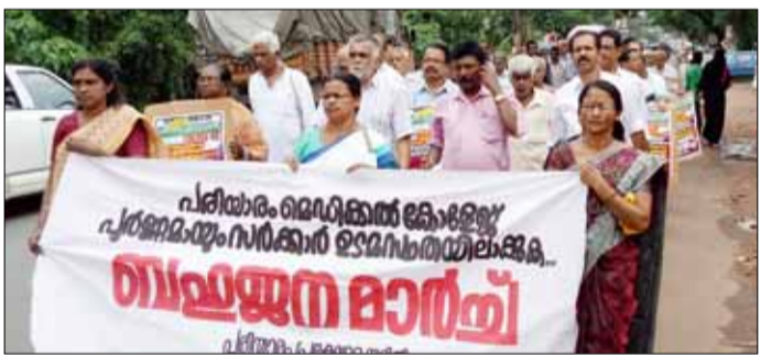
പരിയാരം മെഡിക്കൽ കോളേജിലേക്ക് നടന്ന ബഹുജന മാർച്ച്