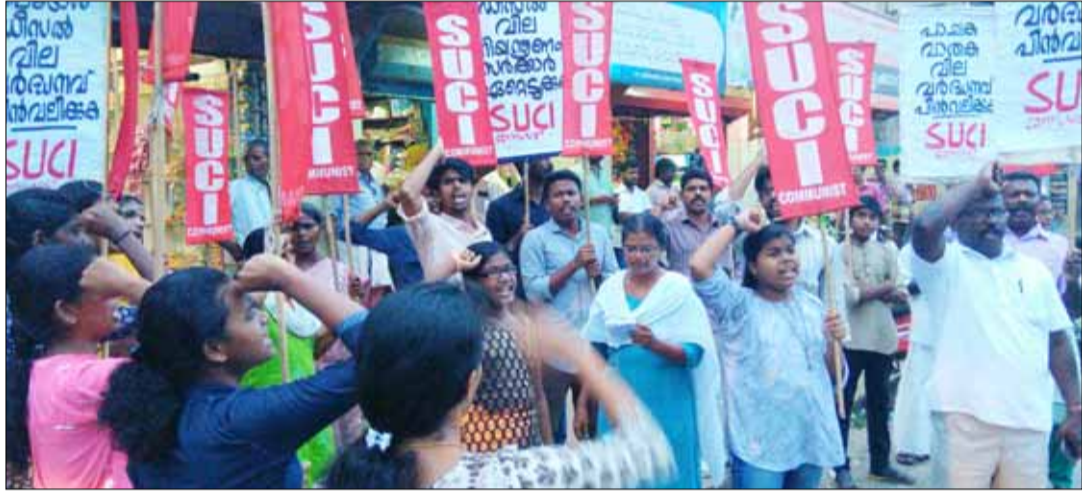
ചങ്ങനാശ്ശേരിയിൽ നടന്ന പ്രതിഷേധ പ്രകടനം

ങ്ങളാണ് സർക്കാർ പറയുന്നതെങ്കിലും കർണ്ണാടക നിയമസഭാ തിരഞ്ഞെടുപ്പിന്റെ സമയത്ത് നീണ്ട പത്തൊൻപത് ദിവസം പെട്രോൾ-ഡീസൽ വില ഇളക്കമില്ലാതെ നിന്നു എന്നത് ശ്രദ്ധേയമാണ്. സർക്കാർ തീരുമാനിച്ചാൽ വില വർദ്ധിക്കാതെ യുതിരിക്കും. പാചകവാതകത്തിനും സിലിണ്ടർ ഒന്നിന് 48 രൂപയുടെ ഭീമമായ വർദ്ധനവ് അടിച്ചേൽപ്പിച്ചിരിക്കുകയാണ്. വർദ്ധിച്ചു തുക സബ്സിഡിയായി ബാങ്കിൽ വരുമത്രെ. 2017 മാർച്ചിൽ ഒറ്റയടിക്ക് സിലിണ്ടർ ഒന്നിന് 86 രൂപയുടെ വർദ്ധനവാണ് അടിച്ചേൽപ്പിച്ചത്. അതിന് പിന്നാലെയാണ് വീണ്ടും വർദ്ധനവ് വന്നിരിക്കുന്നത്. സബ്സിഡി പൂർണ്ണമായും