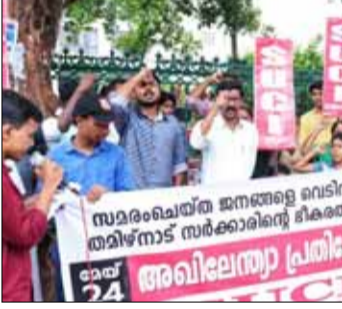
സെക്രട്ടേറിയറിന് മുൻപിൽ നടന്ന പ്രതിഷേധ പ്രകടനം

പോലെ ഇടത് എന്ന് അവകാശപ്പെടുന്ന പാർട്ടികൾ പോലും ഇന്ന് സമരപാത വെടിഞ്ഞ് അധികാരത്തിന്റെ ഇടനാഴികളിൽ ഭാഗ്യാനുഭവികളായി അലയാനും മുതലാളിവർഗ്ഗത്തെ അലോസരപ്പെടുത്തുന്ന എല്ലാ നടപടികളിൽനിന്നും തലയുരാനും ശ്രമിക്കുകയാണ്.