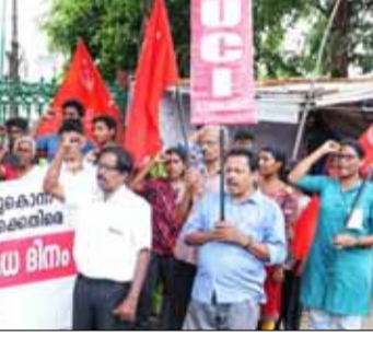
സെക്രട്ടേറിയറിന് മുൻപിൽ നടന്ന പ്രതിഷേധ പ്രകടനം

എംകെ പാർട്ടികളുമായി മാത്രമല്ല, ബിജെപി, കോൺഗ്രസ് കക്ഷികളുമായും കമ്പനി നല്ല ചങ്ങാത്തത്തിലാണ്. കോൺഗ്രസിന്റെ നേതൃത്വത്തിലുള്ള യുപിഎ മന്ത്രിസഭയിൽ ധനകാര്യ മന്ത്രിയായിരുന്നയാൾ കമ്പനിയുടെ നിയമോപദേശക സമിതി അംഗമായിരുന്നു. കമ്പനിക്ക് അനുകൂലമായ സാമ്പത്തിക നടപടികൾ ഇന്റേണൽസിന് ഉണ്ടായിട്ടുണ്ട്. ഇപ്പോൾ നരേന്ദ്രമോദിയുമായി അടുത്ത ബന്ധത്തിലാണ് ഇവർ. ബിജെപിയുടെ പ്രൈവറ്റ്-പബ്ലിക് പാർട്ണർഷിപ്പ് സംരംഭങ്ങളുടെ രാജ്യത്തും പുറത്തുമുള്ള പ്രചാരകരാണ് വേദാന്ത ഗ്രൂപ്പ്.