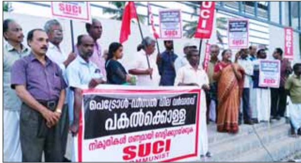
കൊല്ലം ടൗണിൽ നടന്ന പ്രതിഷേധ യോഗം

ത്. 'ക്ഷേമപ്രവർത്തന'ങ്ങളെയും 'വികസനപ്രവർത്തന'ങ്ങളെയും ഇത് പ്രതികൂലമായി ബാധിക്കുമെന്നാണ് സർക്കാർ നിലപാട്. ജനങ്ങളെ കുത്തിക്കവർന്ന്, ജീവിക്കാനുള്ള അവരുടെ അവകാശം പോലും നിഷേധിക്കുന്ന സർക്കാർ നടത്തുന്ന 'ക്ഷേമ-വികസന പ്രവർത്തനങ്ങൾ' എന്തായാലും ജനങ്ങളുടെ ഉന്നമനം ലക്ഷ്യം വച്ചുകൊണ്ടുള്ളതല്ല. ജീവി