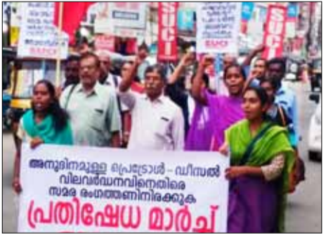
പാലക്കാട് ടൗണിൽ നടന്ന പ്രതിഷേധ പ്രകടനം

ടെ പ്രധാന മന്ത്രി ആയിരുന്ന കാലത്താണ് പെട്രോളിന്റെ വില നിയന്ത്രണം എണ്ണക്കമ്പനികളെ ഏൽപ്പിക്കുന്നത്. അപ്പോഴും ഡീസൽ വില നിയന്ത്രണാധികാരം സർക്കാരിൽ നിക്ഷിപ്തമായിരുന്നു. പെട്രോളിന്റെ അനിയന്ത്രിതമായ വിലക്കയറ്റം ബിജെപി എന്നും രാഷ്ട്രീയ ആയുധമാക്കിയിരുന്നു. വിലനിയന്ത്രിക്കാനാകാത്തത് കോൺഗ്രസിന്റെ പരാജയമാണ് എന്ന് പ്രചാരണം നടത്തിക്കൊണ്ടിരുന്ന ബിജെപി 2014 ലെ പാർലമെന്റ് തെരഞ്ഞെടുപ്പിലും അത് ആയുധമാക്കി. എന്നാൽ അധികാരത്തിലേറി വൈകാതെ