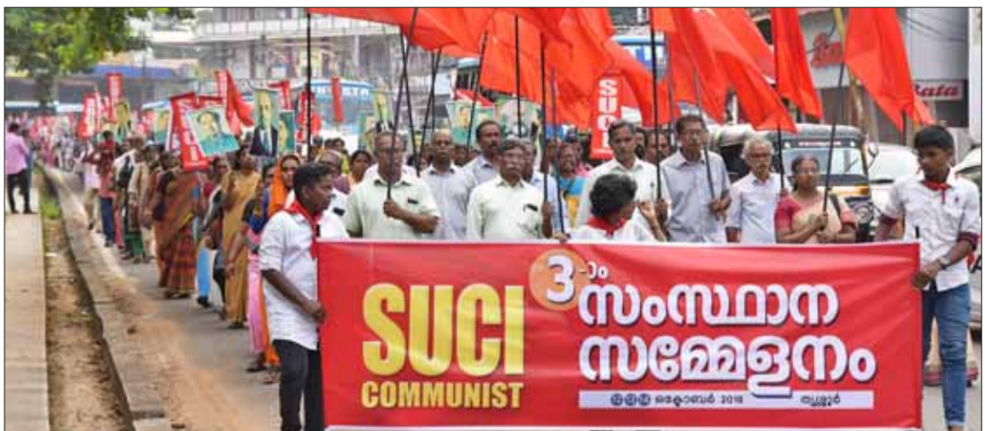
പൊതുസമ്മേളനത്തിന് മുന്നോടിയായി തൃശൂർ നഗരത്തിൽ നടന്ന പ്രകടനം

ജാർഖണ്ഡിൽ നടക്കുന്ന പാർട്ടിയുടെ മൂന്നാം കോൺഗ്രസ്സിന് മുന്നോടിയായി മൂന്നാം സംസ്ഥാന സമ്മേളനം ഒക്ടോബർ 12,13,14 തീയതികളിൽ തൃശൂരിൽ നടക്കുകയുണ്ടായി. 11 ജില്ലകളിൽ സമ്മേളനവും 2 ജില്ലകളിൽ കൺവൻഷനും വിജയകരമായി പൂർത്തിയാക്കിയതിനുശേഷമാണ് പാർട്ടിയൊന്നാകെ സംസ്ഥാന സമ്മേളനത്തിലേക്ക് നീങ്ങിയത്. പാർട്ടിയുടെ വർത്തമാനകാലത്തെ സംഘടനാപരമായ ആവശ്യകതകൾ നിറവേറ്റുക എന്ന മുഖ്യമായ ലക്ഷ്യം മുൻനിർത്തിയാണ് കേന്ദ്ര കമ്മിറ്റി പാർട്ടി കോൺഗ്രസ്സും അതിനു മുന്നോടിയുള്ള സമ്മേളനങ്ങളും വിളിച്ചുചേർത്തത്. ഒപ്പം, ദേശീയ-സാർവ്വദേശീയ സാഹചര്യത്തെ സംബന്ധിച്ചുള്ള പാർട്ടിയുടെ തീസിസുകൾ ഏറ്റവും