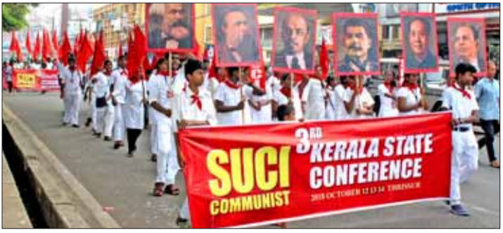
പ്രകടനത്തിന് മുൻപിലെ കോസമോൾ മാർച്ച്

സംസ്ഥാനത്തിന്റെ മണ്ണിൽ കൂടുതൽ ഉയർന്ന വിപ്ലവഗുണങ്ങളോടടുത്തുള്ള ഒരു പാർട്ടി സംഘടനയും അതിന്റെ നേതൃത്വത്തിൽ ശക്തമായ ജനപിന്തുണയും പടുത്തുയർത്താനുള്ള വിപ്ലവ സമരങ്ങൾക്കായി തങ്ങളെ ഓരോരുത്തരെയും സമർപ്പിക്കുമെന്ന് പ്രതിജ്ഞ ചെയ്തുകൊണ്ടാണ് പ്രതിനിധി സഖാക്കൾ പിരിഞ്ഞത്.