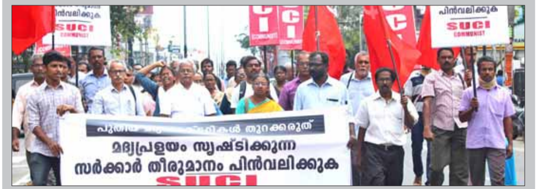
പുതിയ മദ്യനിർമ്മാണ ഫാക്ടറികൾ തുറക്കാനുള്ള തീരുമാനം പിൻവലിക്കണമെന്ന് ആവശ്യപ്പെട്ടുകൊണ്ട് സെപ്തംബർ 28ന് എസ്.യു.സി.എ.എ. (കമ്മ്യൂണിസ്റ്റ്) പാർട്ടിയുടെ ആഭിമുഖ്യത്തിൽ സെക്രട്ടേറിയറിന് മുൻപിൽ നടന്ന പ്രതിഷേധ പരിപാടി