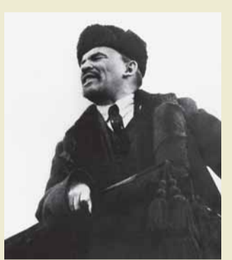
മഹത്തായ നവംബർ വിപ്ലവത്തിന്റെ 101-ാം വാർഷിക സമുചിതം ആചരിക്കുക

1917ൽ സോവിയറ്റ് യൂണിയനിൽ അധികാരത്തിലേറിയ തൊഴിലാളിവർഗ്ഗം അധ്വാനിക്കുന്ന മറ്റ് ജനവിഭാഗങ്ങളുമായിച്ചേർന്ന് പുതിയൊരു സംസ്കൃതി പടുത്തുയർത്തി. മനുഷ്യൻ മനുഷ്യനുമേൽ നടത്തുന്ന എല്ലാത്തരം ചൂഷണവും അവർ അവസാനിപ്പിച്ചു. ഭൗതികമായ ഉല്പാദനത്തെ മാത്രമല്ല, വിജ്ഞാനത്തെയും ശാസ്ത്രത്തെയും കലയെയുമെല്ലാം മുതലാളിത്ത ചൂഷണത്തിന്റെ നീരാളിപ്പിടുത്തത്തിൽനിന്ന് മോചിപ്പിച്ചുകൊണ്ട് മനുഷ്യന്റെ സർഗ്ഗശേഷിയെ കെട്ടിപ്പിടിച്ചു.