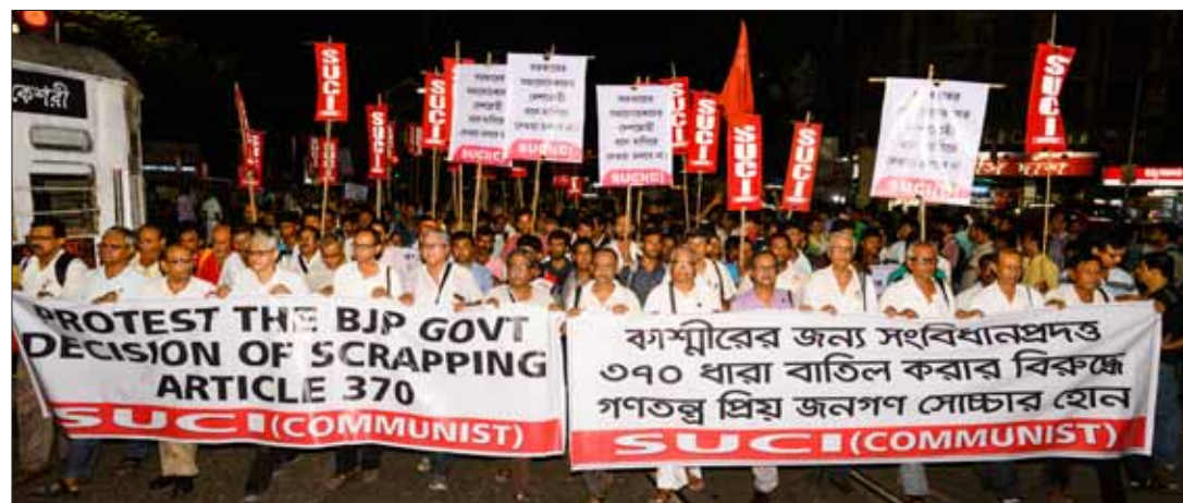
രാഷ്ട്രപതിയുടെ ഉത്തരവിനെതിരെ ആഗസ്റ്റ് 5ന് കൊൽക്കത്തയിൽ നടന്ന വമ്പൻ പ്രകടനം

സഹായം നൽകാനാവൂ എന്ന നിലപാടെടുത്ത അന്നത്തെ ഇൻഡ്യൻ ഭരണ നേതൃത്വത്തിന് വഴങ്ങിക്കൊണ്ട് കരാറിൽ (Instrument of Accession) രാജാവ് ഒപ്പിടുകയാണ് ചെയ്തത്. ഈ സംയോജനകരാറിന്റെ വകുപ്പ് 3ൽ പ്രതിരോധം, വാർത്താവിനിമയം, വിദേശകാര്യം എന്നീ വിഷയങ്ങളിലൊഴികെ മറ്റൊരു വിഷയത്തിലും കാശ്മീരിനെ സംബന്ധിച്ച് നിയമനിർമ്മാണം നടത്താൻ ഇൻഡ്യൻ ഡൊമീനിയൻ അധികാരമുണ്ടായിരിക്കുന്നതല്ല എന്ന് വ്യക്തമായി രേഖപ്പെടുത്തിയിരിക്കുന്നു. ഇൻസ്ട്രുമെന്റ് ഓഫ് അക്സഷന്റെ ഉള്ളടക്കത്തെയും വികാരത്തെയും ഉൾക്കൊണ്ടുകൊണ്ടാണ് 370-ാം വകുപ്പ് ഭരണഘടനയിൽ ചേർക്കപ്പെട്ടത്. കാശ്മീരിന്റെ സ്വയംഭരണവും വേറിട്ട അസ്തിത്വവും അംഗീകരിക്കാൻ ഇൻഡ്യ തയ്യാറായതു