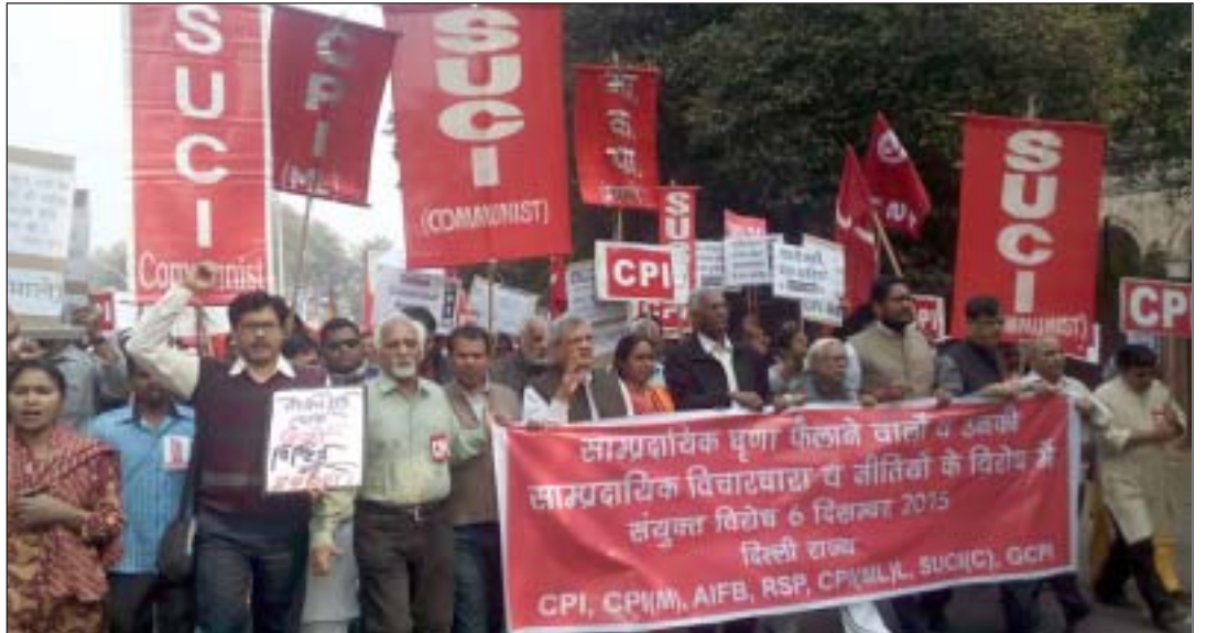
അസഹിഷ്ണുതയ്ക്കെതിരായ ദേശീയപ്രതിഷേധത്തിന്റെ ഭാഗമായി ഇടതുപാർട്ടികളുടെ നേതൃത്വത്തിൽ ഡൽഹിയിൽ നടന്ന റാലി