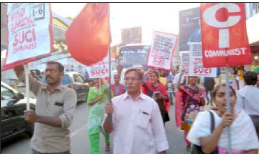
ദേശീയ പ്രതിഷേധത്തോടനുബന്ധിച്ച് പാലക്കാട് നടന്ന പ്രതിഷേധ പ്രകടനം