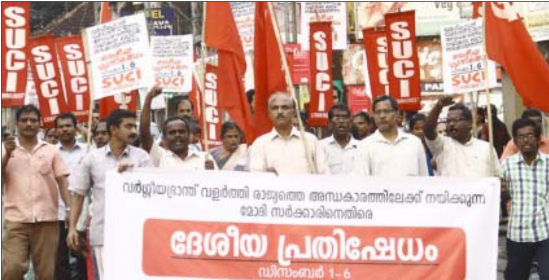
ദേശീയ പ്രതിഷേധത്തോടനുബന്ധിച്ച് കോട്ടയത്ത് നടന്ന പ്രതിഷേധ പ്രകടനം

ത്തൊഴിലാളികളെ നേരിടുന്ന നേരിടുന്ന മോദി ഗവണ്മെന്റ് കൈക്കൊള്ളുന്നത്. ജനശ്രദ്ധ തിരിച്ചുവിട്ട് കോർപ്പറേറ്റ്-മുലധന ശക്തികളെ സംരക്ഷിക്കുവാനാണ് മോദി സർക്കാർ വർഗ്ഗീയത ആളിപ്പടർത്താനും അന്ധവിശ്വാസങ്ങളെ ഉൾക്കൊള്ളുന്നതും ശ്രമിക്കുന്നത്. ബഹുജനങ്ങൾ അണിനിരക്കുന്ന രാജ്യവ്യാപകമായ ജനാധിപത്യപ്രക്ഷോഭങ്ങൾക്കു മാത്രമേ വർഗ്ഗീയ-ഹാസിസ്റ്റ് വിപത്തിൽനിന്ന്