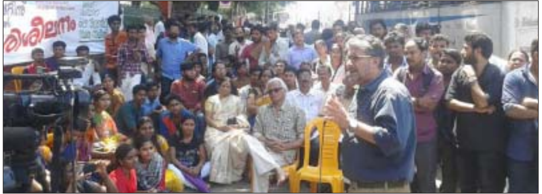
പ്രശസ്ത ചലച്ചിത്ര സംവിധായകൻ ശ്യാമപ്രസാദ് കലാപരിശീലന സമരം ഉദ്ഘാടനം ചെയ്യുന്നു

ഇന്ന് എല്ലാവർക്കുമറിയാം. സർഗാത്മക പഠനം എന്നതും വെറും വചാഭാഷം മാത്രമാണ് എന്നതിന്റെ പ്രത്യക്ഷ ഉദാഹരണമാണ് കലാപഠനത്തിന് എന്ന പേരിൽ നീക്കിവച്ചതുക വിനിയോഗിക്കാതിരിക്കലും അധ്യാപകരെ നിയമിക്കാതിരിക്കലും. എല്ലാ കലാരൂപങ്ങൾക്കും ശാസ്ത്രീയമായ ക്രമങ്ങളും വികാസചരിത്രവുമുണ്ട്. ഇത് അഭ്യസിച്ചവർക്ക് മാത്രമേ ശാസ്ത്രീയമായ പരിശീലനം നൽകുവാനാകൂ. കലാ ശാസ്ത്രീയമായി പഠിച്ചവർക്ക് പകരം മറ്റുവിഷയങ്ങളിൽ പ്രാവീണ്യമുള്ളവരെ കലാപരിശീലനത്തിന് നിയോഗിക്കാനായിരുന്നു സർക്കാർ നീക്കം. ഈ തീരുമാനം വികലവും കലാപഠനത്തെ ഒരു പ്രഹസനമാക്കിത്തീർക്കുന്നതുമാണ്.