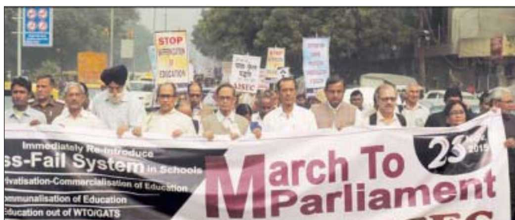
2015 നവംബർ 23 ന് അഖിലേന്ത്യാ സേവ് എജ്യൂക്കേഷൻ കമ്മിറ്റിയുടെ ആഭിമുഖ്യത്തിൽ പാർലമെന്റിനുമുന്നിൽ നടന്ന പടുകുറ്റൻ ബഹുജനറാലിയുടെ മുൻനിര