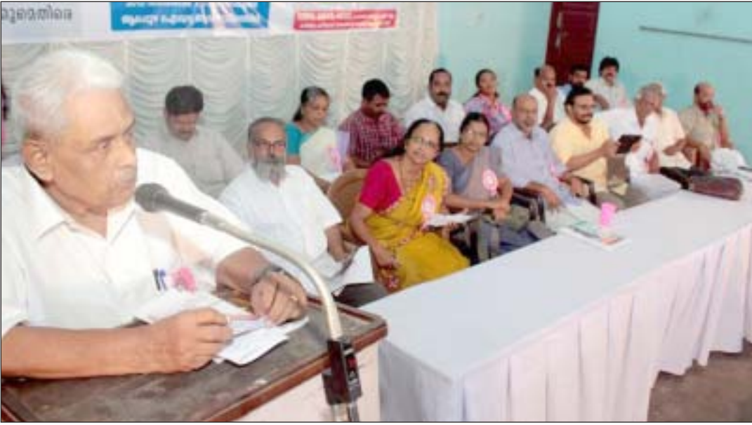
ആലപ്പുഴയിൽ നടന്ന മതേതര ജനാധിപത്യസംഗമവും നവോത്ഥാന ശക്തി ചരിത്ര പ്രദർശനവും വിഖ്യാത ചരിത്രകാരൻ ഡോ.എം.ജി.എസ്.നാരായണൻ ഉദ്ഘാടനം ചെയ്യുന്നു

മതത്തിന്റെയും ജാതിയുടേയും പേരിൽ മനുഷ്യനെ നിരാകരിക്കുന്ന രാഷ്ട്രീയ സാഹചര്യത്തിനെതിരെ അഖിലേന്ത്യാ മഹിളാ സാംസ്കാരിക സംഘടനയും (എഐഎംഎസ്എസ്), ആൾ ഇന്ത്യാ ഡമോക്രാറ്റിക് യൂത്ത് ഓർഗനൈസേഷനും (എഐഡിവൈ) ആൾ ഇന്ത്യാ ഡമോക്രാറ്റിക് സ്റ്റുഡന്റ്സ് ഓർഗനൈസേഷനും (എഐഡിഎസ്) മഹാനായ അയ്യൻകാളി നയിച്ച കാര്യപരിപാടി ആചരണ സമിതിയും ചേർന്ന് ഡിസംബർ 2,3 തീയതികളിൽ മതേതരജനാധിപത്യ മാനവിക സംഗമവും നവോത്ഥാന ശക്തി ചരിത്ര പ്രദർശനവും സംഘടിപ്പിച്ചു. ആലപ്പുഴ ഐശ്വര്യ ആഡിറ്റോറിയത്തിൽ നടന്ന സംഗമവും ചരിത്ര പ്രദർശനവും വിഖ്യാത ചരിത്രകാരൻ ഡോ.എം.ജി.എസ്.നാരായണൻ ഉദ്ഘാടനം ചെയ്തു. “ശ്രീനാരായണ ഗുരുവിനേയും, അയ്യൻകാളിയേയും ജാതിനേതാക്കളായി ചിത്രീകരിക്കുന്നത് ചരിത്രത്തിനും ഈ മഹാനായ ജീവിത ദർശനങ്ങൾക്കും വിരുദ്ധമാണ്. തനിക്കു ജാതിയില്ല എന്നു ഗസറ്റു വിജ്ഞാപനം നടത്തിയ ആളാണ് നാരായണഗുരു. ക്ഷേത്ര പ്രവേശനത്തിനുള്ള അവകാശമല്ല മറിച്ച് ഭക്ഷണവും മാനുഷമായ ജീവിത സാഹചര്യവുമാണ് പ്രധാനമെന്ന് അയ്യൻകാളി കരുതിയിരുന്നു. ജാതിയ്ക്കും മതത്തിനുമതീതമായി മനുഷ്യനെ സൃഷ്ടിക്കുകയെന്ന നവോത്ഥാന നായകന്മാരുടെ ലക്ഷ്യം സമൂഹത്തിന്റെ പൊതു ബോധത്തിൽ സ്ഥാപിക്കപ്പെട്ടില്ലെന്നതാണ് ഇന്നത്തെ അപചയത്തിനു കാരണം”. സംഗമം ഉദ്ഘാടനം ചെയ്തുകൊണ്ട് അദ്ദേഹം പറഞ്ഞു. “ബുദ്ധനോ വ്യാസനോ വാത്മീകിയോ ഒന്നും മതസ്ഥാപകരായിരുന്നില്ല. ഹിന്ദുമതം ചരിത്രപരമായി സ്ഥാപിക്കപ്പെട്ടതല്ല എന്ന വസ്തുതയും ഭരണാധികാരികൾ വിസ്മരിക്കുന്നു. രാമായണത്തെയും മഹാഭാരതത്തെയും മനോഹരമായ സാഹിത്യ സൃഷ്ടിയായി കാണുവാൻ സാധിക്കാതെ മതഗ്രന്ഥമായി കാണുന്നത് വസ്തുതാവിരുദ്ധമാണ്”. അദ്ദേഹം അഭിപ്രായപ്പെട്ടു.