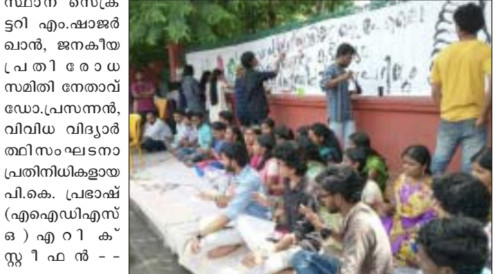
കലാമണ്ഡലം, ചെന്നൈ സംഗീത കോളേജ് പാലക്കാട്, ശ്രീശങ്കരാ യൂണിവേഴ്സിറ്റി കാലടി, രവിവർമ്മ കോളേജ് ഓഫ് ഫൈൻ ആർട്സ് മാവേലിക്കര, സ്വാതി തിരുനാൾ സംഗീത കോളേജ് തിരുവനന്തപുരം, കോളേജ് ഓഫ് ഫൈൻ ആർട്സ് തിരുവനന്തപുരം, സ്കൂൾ ഓഫ് ഡ്രാമ തൃശൂർ എന്നീ കലാലയ