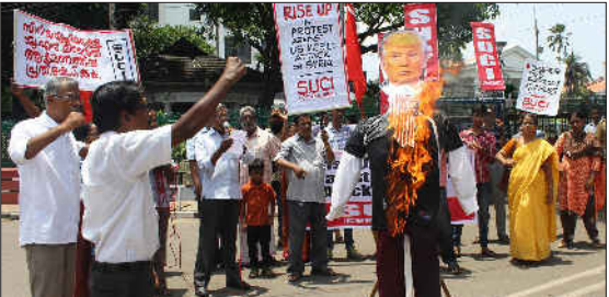
തിരുവനന്തപുരത്ത് സെക്രട്ടേറിയറ്റിന് മുമ്പിൽ ഡൊണാൾഡ് ട്രാമ്പിന്റെ കോലം കത്തിക്കുന്നു

മിന്റെ നിരീക്ഷണ സൈനികബോട്ടുകൾ യു.എസ് യുദ്ധക്കപ്പലിനു നേരെ ആക്രമണം നടത്തി എന്ന വ്യാജവാർത്ത യു.എസ് അധികൃതർ പ്രചരിപ്പിക്കുകയും അതിന്റെ പേരിൽ അതിനിഷേധം യുദ്ധാക്രമണം വിയർന്നാമിനെതിരെ അഴിച്ചുവിടുകയും ചെയ്തു. പത്ത് വർഷങ്ങൾക്ക് മുമ്പ്, ഇറാഖി പ്രസിഡന്റ് സദ്ദാം ഹുസൈൻ മരുകായുധങ്ങൾ കൈവശം വച്ചിരിക്കുന്നുവെന്ന കപടവാദമുയർത്തി ആ രാജ്യത്ത് അധിനിവേശം നടത്തുകയും കുട്ടികളും സ്ത്രീകളും ഉൾപ്പെടെ 3 ലക്ഷത്തിൽ