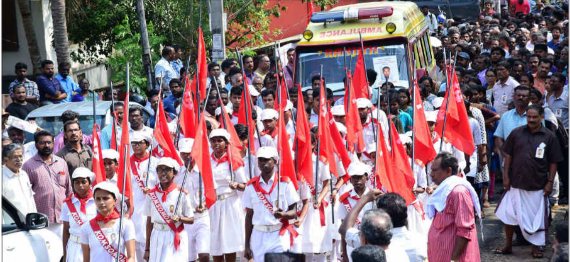
കോസമോൾ വോളന്റിയർമാരുടെ അകമ്പടിയോടെ അന്ത്യയാത്ര

ഈ വേർപാട് പാർട്ടിക്ക് കനത്ത നഷ്ടം സൃഷ്ടിക്കുമെങ്കിലും സഖാവ് ശിബ്ദാസ് ഘോഷിന്റെ പാഠങ്ങളുടെ വെളിച്ചത്തിൽ കൂടുതൽ തിക്ഷണമായി സമരത്തിൽ മുഴുകിക്കൊണ്ട് ആ നഷ്ടം നീകത്തുമെന്ന് മുഴുവൻ സഖാക്കളും പ്രതിജ്ഞയെടുത്തു. ●