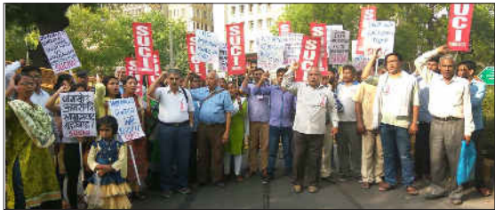
ഡൽഹിയിൽ നടന്ന പ്രതിഷേധ റാലി

കൂട്ടായ്മയോടൊത്ത് അപ്പോഴത്തെ യു.എസ് പ്രതിരോധ സെക്രട്ടറിയായ ജെയിംസ് മാറ്റിൻ തന്നെ വ്യക്തമാക്കിയതോടെ യു.എസിന്മേൽ കള്ളപ്രചാരണമായിരുന്നുവെന്ന് തെളിഞ്ഞു. നേരെമറിച്ച്, രഹസ്യ അന്വേഷക ഏജൻസികളുടെ കണ്ടെത്തലുകൾ സൂചിപ്പിക്കുന്നത്, ഖാൻ ഷെയ്ഖുണിലെ സിറിയൻ പൗരന്മാർക്കു മേലുള്ള കുറ്റകരമായ രാസായുധ പ്രയോഗം അസർ ഗവണ്മെന്റിനെ പുറത്താക്കുന്നതിനുവേണ്ടി യു.എസ് ഇന്റലിജൻസ് ആസൂത്രണം ചെയ്തത് നടപ്പിൽവരുത്തിയാണെന്നാണ്. തങ്ങളുടെ നിഷ്പക്ഷമായ ദൗത്യം നടപ്പിൽവരുത്താനുള്ള അട്ടിമറികളിൽനിന്ന് പിന്മാറ്റം ചെയ്യാൻ യു.എസ് സാമ്രാജ്യത്വം ഒട്ടും ഇരട്ടിച്ചില്ല. സിറിയൻ തലസ്ഥാനമായ ദമാസ്കസിലേക്ക് തൊട്ടുചേർന്നുള്ള കിഴക്കൻ ഗുഡയിലെ ദുമ്മ എന്ന പട്ടണം വളരുകാലമായി സയറായ നിരവധി ഭീകരവാദി ഗ്രൂപ്പുകളുടെ നിയന്ത്രണത്തിലാണ്. സാദി പിന്തുണയ്ക്കുന്ന ജയ്ഷ് അൽ-ഇസ്ലാം, അൽ-ഖെയ്ദ ബന്ധമുള്ള ഹയ്ദർ താഹിർ അൽ-ഷാ, യു.എസിന്റെയും യൂറോപ്പിലെ അവരുടെ സാമ്രാജ്യത്വ കുട്ടാളികളുടെയും പിന്തുണയുള്ള അഹ്ൻ അൽ-ഷാ തുടങ്ങിയവ അവയിൽപ്പെടുന്നു. ഉപരോധത്തിലായ ഈ നഗരത്തെ ഉപയോഗപ്പെടുത്തിയാണെന്ന് ഭീകരവാദ-മതമതലിക്വാദ ശക്തികൾ ദമാസ്കസ് ഉന്നമാക്കി മാതൃകയായ മിസ്രയെലുമെന്ന നട്ടത്തുകയും സർക്കൂട്ടുകൾ ഉൾപ്പെടെയുള്ള പൗരന്മാരെ കൊലപ്പെടുത്തുകയും ചെയ്യുന്നത്. ഫെബ്രുവരി 21 മുതൽ അത്തരം നിരന്തരമായ മിസ്രയെൽ ആക്രമണം നടന്നുവരികയായിരുന്നു. കിഴക്കൻ ഗുഡയെ ഭീകരവാദികളുടെ നിയന്ത്രണത്തിൽനിന്ന് മോചിപ്പിച്ചുകൊണ്ടല്ലതെ മദനസ്കസ് സംരക്ഷിക്കാനായില്ല എന്ന ഒരു സ്ഥിതിയിലേക്ക് സിറിയൻ ആർമിയെ