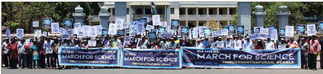
മാർച്ച് ഫോർ സയൻസ് തിരുവനന്തപുരത്ത് കേരള യൂണിവേഴ്സിറ്റി ആസ്ഥാനത്തിന് മുമ്പിൽ സമാപിച്ചപ്പോൾ