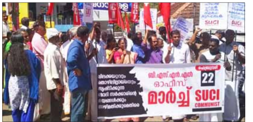
കൊല്ലം ഹെഡ് പോസ്റ്റ് ഓഫീസ് മാർച്ച്