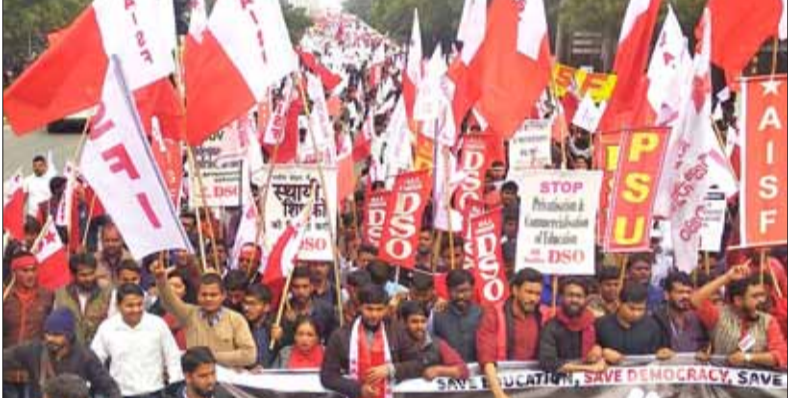
ഇടത് വിദ്യാർത്ഥി സംഘടനകളുടെ ആഭിമുഖ്യത്തിൽ ഫെബ്രുവരി 18ന് നടന്ന പാർലമെന്റ് മാർച്ച്