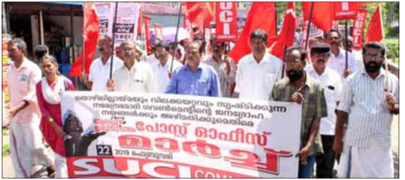
ആലപ്പുഴ ടൗണിൽ നടന്ന പോസ്റ്റ് ഓഫീസ് മാർച്ച്

ജില്ലാ ഓർഗനൈസിംഗ് കമ്മിറ്റിയുടെ ആഭിമുഖ്യത്തിൽ മലപ്പുറം ടൗണിൽ നടന്ന പ്രതിഷേധ ധർണ്ണ, അഖിലേന്ത്യാ മഹിളാ സാംസ്കാ