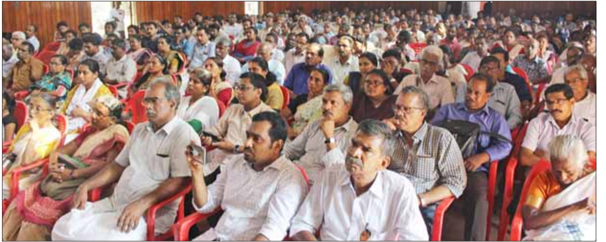
തിരുവനന്തപുരം അനുസ്മരണ സമ്മേളനം: വിജെടി ഹാളിലെ സദസ്സ്