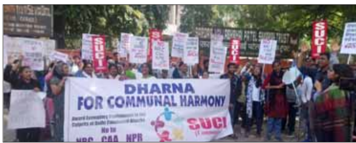
ഡൽഹി അക്രമത്തിൽ പ്രതിഷേധിച്ച് എസ്യുസിഐ(സി) സംഘടിപ്പിച്ച മത സൗഹാർദ്ദ ധർണ്ണ

നേക്കാൾ വളരെ ഉയർന്നതാണ്. പരിക്കേറ്റവർ നൂറുകണക്കിനാണ്. ദിവസം കഴിയുന്തോറും മരിച്ചവരുടെ എണ്ണം വർദ്ധിക്കുന്നു. മേൽപ്പറഞ്ഞ പത്രം തന്നെ പ്രമുഖനായ ഒരു ബിജെപി നേതാവിന്റെ നേതൃത്വത്തിൽ നയിക്കപ്പെട്ട അക്രമിസംഘം പോലീസിന്റെ ഒത്താശയോടെ എത്രമനുഷ്യത്വ ഹീനവും ഭ്രാന്തും ആയിരുന്നു എന്ന് കാണിക്കാൻ 'ഭീകരസത്യാം' എന്നാണ് പ്രയോഗിച്ചത്. സി.എ.എ. അനുകൂലികളായ അക്രമികൾ പോലീസ് ബാരിക്കേഡുകൾ ചാടിക്കടന്ന്, വടക്കുകിഴക്കൻ ഡൽഹിയിലെ ജാഹ്നാബാദിൽ, സിഎഎ - എൻആർസി വിരുദ്ധ സമരക്കാർക്കുനേരെ കല്ലെറിയുന്ന