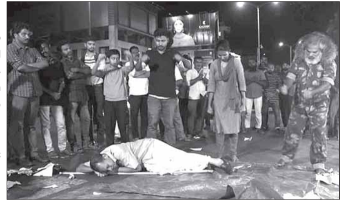
സമരത്തിന് ആവേശംപകർന്ന് തെരുവുനാടകം