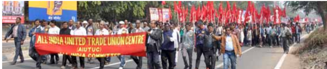
വമ്പിച്ച തൊഴിലാളിപ്രകടനത്തിന്റെ മുൻനിര

ക്കുന്നുണ്ടെന്നും, ഉരുക്ക്, കൽക്കരി, വൈദ്യുതി, മത്സ്യബന്ധനം, സ്കീംവർക്കർമാർ, തോട്ടം തുടങ്ങിയ ഫെഡറേഷനുകളിലായി 47 ലക്ഷം അംഗങ്ങളുണ്ടെന്നും റിപ്പോർട്ട് ചൂട്ടിക്കാട്ടി. പിഎഫ്, ഇഎസ്ഐ, സോഷ്യൽ സെക്യൂരിറ്റി ബോർഡ്, മിനിമംവേജ് അഡ്വൈസറി ബോർഡ് തുടങ്ങി ഇന്ത്യാ ഗവൺമെന്റിന്റെ എല്ലാ കമ്മിറ്റികളിലും തൊഴിലാളികളെ പ്രതിനിധീകരിച്ച് എഐയുടിയുസി പ്രവർത്തിക്കുന്നുണ്ട്. 1999 മുതൽ ഇന്റർനാഷണൽ ലേബർ