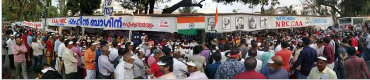
തിരുവനന്തപുരം ഷഹീൻബാഗിൽ ഫെബ്രുവരി 15 ന് നടന്ന ആസാദി മീറ്റ്

രുന്നതാണ് നാം കാണുന്നത്. ന്യൂഡൽഹിയിലെ തന്നെ സീലാലംപുരിൽ, കൊൽക്കത്തയിലെ പാർക്ക് സർക്കിളിൽ, ലക്നൗവിൽ, മുബൈയിൽ, പാട്നയിൽ, ചെന്നൈയിൽ, മധുരയിൽ, തിരുവനന്തപുരത്ത് എന്നിങ്ങനെ തലസ്ഥാനനഗരങ്ങളിലും പീന്നിട് വിവിധ പട്ടണങ്ങളിലും ഗ്രാമങ്ങളിലും ഷഹീൻബാഗുകൾ ഉയർന്നുകൊണ്ടിരിക്കുന്നു. കേരളത്തിൽ കോഴിക്കോട്, വടകര, മലപ്പുറം, കൊല്ലം അയത്തിൽ, കണ്ണൂരിൽ തുടങ്ങി നിരവധി സ്ഥലങ്ങളിൽ സ്ത്രീകളുടെയും രാഷ്ട്രീയ സംഘടനകളുടെയും പൊതുവേദികളുടെയും നേതൃത്വത്തിൽ ഷഹീൻബാഗ് സമരകേന്ദ്രങ്ങൾ സജീവമായി പ്രവർത്തിക്കുന്നു. അക്ഷരാർത്ഥത്തിൽ, ഒരു കൂട്ടം വിദ്യാർത്ഥികളും അമ്മമാരും മാണ് തിരുവനന്തപുരത്ത് ഫെബ്രുവരി 3 ന് സെക്രട്ടേറിയറ്റിനുമുന്നിൽ ഷഹീൻബാഗ് മോഡൽ സമരത്തിന് മുന്നിട്ടിറങ്ങിയത്. 'എവേക്' എന്ന വാട്സ് അപ്പ് കൂട്ടായ്മയാണ് അതിന് മുൻകൈയെടുത്തത്. ജനുവരി 13 ന്, ഗാന്ധിപാർക്കിൽ കേരള സംസ്ഥാന ജനകീയ പ്രതിരോ