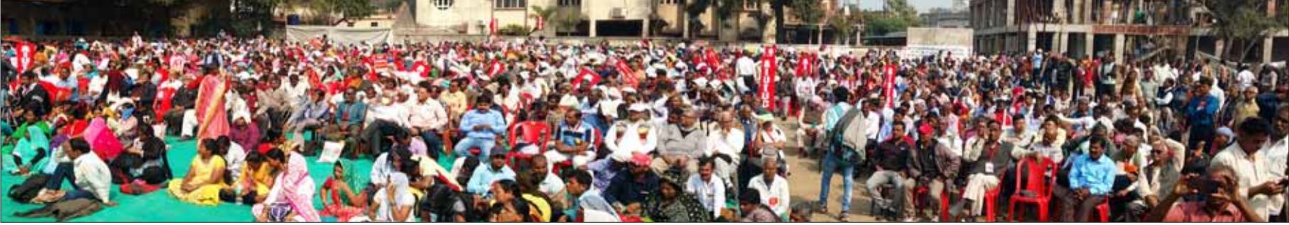
ധൻബാദ് കോഹിന്നൂർ മൈതാനത്തെ പൊതുസമ്മേളന സദസ്സ്

വീണ്ടും പ്രതിസന്ധി രൂക്ഷമാക്കുന്നു. മാന്ദ്യത്തിന്റെ പിടിയിൽ അമർന്നിരിക്കുകയാണ് സമ്പദ് വ്യവസ്ഥ. അത്തരമൊരു സാഹചര്യത്തിൽ, മുതലാളിത്ത വ്യവസ്ഥ പ്രതിസന്ധിയെ മറികടക്കാൻ ശ്രമിക്കുന്നോടും അത് ആഴമേറിയ പ്രതിസന്ധിയിൽ കൂടുണ്ടുകയാണ്. ജീർണ്ണമായ ഈ മുതലാളിത്ത വ്യവസ്ഥ ഇപ്പോൾ ദുർഗന്ധം വമിക്കുന്ന ശവശരീരം പോലെയാണ്. സമൂഹത്തെ അഭിവൃദ്ധിയുടെയും തടസ്സമില്ലാത്ത പുരോഗതിയുടെയും പാതയിലേക്ക് കൊണ്ടുപോകാൻ കഴിയുന്ന തരത്തിൽ അതിനെ അടക്കം ചെയ്യേണ്ടത് സമൂഹത്തിന്റെ താല്പര്യമാണ്. ട്രേഡ്യൂണിയൻ പ്രസ്ഥാനം തൊഴിലാളികളുടെ ദൈനംദിന ഉപജീവനത്തിനായുള്ള പോരാട്ടത്തിന്റെ ആയുധമാകുമെങ്കിലും അതിലൂടെ ചൂഷണത്തിൽ നിന്ന് അന്തിമസ്വാതന്ത്ര്യം നേടില്ലെന്നും മുതലാളിത്തചൂഷണം എന്നനേക്കുമായി അവസാനിപ്പിക്കാനുള്ള മുതലാളിത്ത വിരുദ്ധ സോഷ്യലിസ്റ്റ് വിപ്ലവത്തിന് അനുപുരകമായി തൊഴിലാളി പ്രസ്ഥാനത്തെ നയിക്കാൻ നമുക്ക് കഴിയണമെന്നും അദ്ദേഹം പറഞ്ഞു. സാർവ്വദേശീയ തൊഴിലാളിവർഗ്ഗ നാലാപനത്തോടെ 21-ാം അഖിലേന്ത്യാ സമ്മേളനത്തിന് തിരശ്ശീല വീണു.