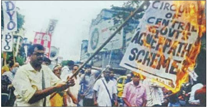
അഗ്നിപഥിനെതിരെ എഐഡിഡൈവെയും എഐഡിഎസ്സും സംയുക്തമായി കൊൽക്കത്തയിൽ സംഘടിപ്പിച്ച പ്രതിഷേധം.

സമരം സ്വമേധയാ പടർന്നത് തൊഴിലില്ലായ്മ എന്ന പ്രശ്നത്തിന്റെ സഹോദരനായ മാനന്തരമാണ് വെളിവാക്കുന്നത്. ആദ്യത്തെ ഊഴത്തിൽ പ്രതി