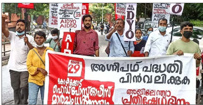
അഗ്നിപഥ് പദ്ധതിക്കെതിരെ ജൂൺ 29ന് എഐഡിഡിഐ, എഐഡിഎസ്ഒ സംഘടനകൾ കോഴിക്കോട് ഹൈഡ് പോസ്റ്റ് ഓഫീസിലേക്ക് നടത്തിയ മാർച്ച്.

വർദ്ധിച്ചുവരികയാണ്. വൻതോതിൽ ജനങ്ങൾ അണിനിരക്കുന്ന പ്രക്ഷോഭങ്ങൾക്കു നേരെ പോലും അതിക്രമം നടത്താൻ ഇത്തരം അക്രമിസംഘങ്ങൾ മുതിരുന്നു. ജനങ്ങളുടെ മേൽ കഠിനമായ നിയന്ത്രണങ്ങളും ഗസ്റ്റപ്പോ സംഘങ്ങൾ പല പേരുകളിൽ വളർത്തിയെടുക്കപ്പെടുന്നു. നാല് വർഷത്തെ സൈനിക പരിശീലനം നേടി അഗ്നിപഥി എന്ന സവിശേഷ പദവിയുമായി സിവിലിയൻ ജീവിതരംഗത്തേക്കു വരുന്നവർ, ഇത്തരം ഫാസിസ്റ്റ് കൂട്ടങ്ങളുടെ അണിപെരുക്കുന്ന സ്ഥിതി ഉണ്ടായാൽ ജനാധിപത്യപ്രക്ഷോഭങ്ങൾ പോലും ഇവരെ ഭയന്ന് പിൻവാങ്ങുന്ന സാഹചര്യമുണ്ടായേക്കാം എന്ന ആശങ്ക ഒരു വിഭാഗമാളുകൾക്കെങ്കിലുമുണ്ട്. ഇനിയും ലിസ്റ്റുചെയ്യപ്പെട്ടിട്ടുള്ള പള്ളികളുടെ പൊളിച്ചടുക്കൽ ജോലി ഏറ്റെടുക്കേണ്ടവരും യജമാനന്മാരുടെ തിരഞ്ഞെടുപ്പ് വിജയങ്ങൾക്ക് പാതയൊരുക്കേണ്ടവരും വർ