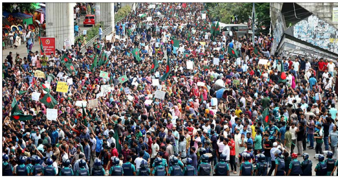
വഴാക്കാ സർവകലാശാലയ്ക്കുമുന്നിൽ തടിച്ചുകൂടിയ പതിനായിരക്കണക്കിന് വിദ്യാർത്ഥിപ്രക്ഷോഭകർ.

ബംഗ്ലാദേശിൽ ഒരു ജനകീയ പ്രക്ഷോഭം കൊടുമ്പിരിക്കൊള്ളുകയാണ്. ഭരണവർഗ്ഗത്തെയും അതിന്റെ സേവകരായ ഭരണകക്ഷിയെയും അത് പിടിച്ചുലച്ചുകഴിഞ്ഞു. ദീർഘകാലമായി തുടരുന്ന അവാമി ലീഗ് ഭരണത്തിന്റെ ജനദ്രോഹ നയങ്ങൾക്കെതിരെ പൊരുതിമുട്ടിയ സാധാരണക്കാർ ഒരു പൊട്ടിത്തെറിയുടെ വക്കിലായിരുന്നു. 1971ലെ സ്വാതന്ത്ര്യ സമരത്തിന് നേതൃത്വം നൽകിയതിന്റെ ഖ്യാതി അവകാശപ്പെടുന്ന അവാമി ലീഗ്, ഷേഖ് ഹസീനയുടെ നേതൃത്വത്തിൽ, ജനാധിപത്യത്തിന്റെ മേലങ്കിയണിഞ്ഞ് പ്രതിഷേധ ശബ്ദങ്ങളെ ക്രൂരമായി അടിച്ചമർത്തുകയായിരുന്നു. ജനരോഷം ഉച്ചസ്ഥായിയിലായതോടെ പ്രതിപക്ഷം മാത്രമല്ല ജനങ്ങളും കഴിഞ്ഞ പൊതുതിരഞ്ഞെടുപ്പ് ബഹിഷ്കരിച്ചു. പാകിസ്ഥാനിൽനിന്ന് വേർപെട്ട ഒരു സ്വതന്ത്ര പരമാധികാര ബുർഷ്യാ രാഷ്ട്രമെന്ന നിലയിൽ ബംഗ്ലാദേശ് രൂപം