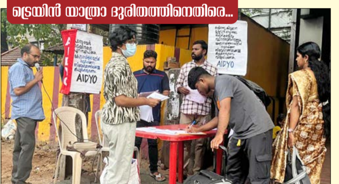
ഇന്ത്യൻ റെയിൽവേയെ സ്വകാര്യവൽക്കരിക്കുന്ന നടപടികൾ അവസാനിപ്പിക്കുക, റെയിൽവേയിൽ ഒഴിവുള്ള മുഴുവൻ തസ്തികകളിലും സ്ഥിര നിയമനം നടത്തുക തുടങ്ങിയ ആവശ്യങ്ങൾ ഉന്നയിച്ചുകൊണ്ട് എഐഡി വൈയുടെ നേതൃത്വത്തിൽ കേന്ദ്ര റെയിൽവേ മന്ത്രിക്ക് സമർപ്പിക്കുന്ന നിവേദനത്തിലേയ്ക്കുള്ള ഒപ്പുശേഖരണം.