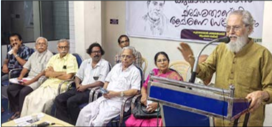
തിരുവനന്തപുരം സത്യൻ സ്മാരക ഹാളിൽ നടന്ന സമ്മേളനം പ്രശസ്ത ചലച്ചിത്രകാരൻ കെ.പി.കുമാരൻ ഉദ്ഘാടനം ചെയ്യുന്നു.