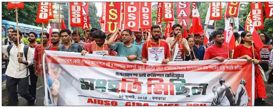
ബംഗ്ലാദേശ് വിദ്യാർത്ഥി പ്രക്ഷോഭത്തിന് ഐക്യദാർഢ്യമർപ്പിച്ചുകൊണ്ട് കൊൽക്കത്തയിൽ എഐഡിഎസ് ഉൾപ്പെടെയുള്ള നാല് ഇടത് വിദ്യാർത്ഥിസംഘടനകളുടെ നേതൃത്വത്തിൽ നടന്ന റാലി.

ഈ ഘടനയ്ക്ക് നിരക്കുന്നതല്ലെന്നും സംവരണം പുനഃസ്ഥാപിക്കണമെന്നുമാണ് കഴിഞ്ഞ ജൂൺ മാസത്തിൽ ഹൈക്കോടതി വിധിച്ചത്. ഇത് കാര്യങ്ങൾ കീഴ്മേൽ മറിച്ചു. ജനരോഷം ആളിക്കത്തി. വിദ്യാർത്ഥികളും യുവാക്കളുമൊക്കെ പ്രതിഷേധമാരാടിച്ചു.