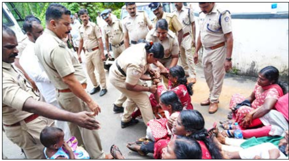
പത്തനംതിട്ട ജില്ലയിലെ കമ്പനാട് ബിറ്റുമിൻ പ്ലാന്റിൽ ലോഡ് കയറ്റി വന്ന ലോറികൾ തടഞ്ഞ സമരസമിതി പ്രവർത്തകരെ പൊലീസ് അറസ്റ്റ് ചെയ്തു നീക്കുന്നു.

തങ്ങളുടെ സംസ്ഥാനത്തെ കർഷകരുടെ നീറുന്ന പ്രശ്നങ്ങൾ കണ്ടെത്തുന്നതിനും, കേന്ദ്ര പ്രവർത്തന പരിപാടികൾക്കൊപ്പം അവരുടെ തനതായ പ്രക്ഷോഭ പരിപാടികൾ ആസൂത്രണം ചെയ്യുന്നതിനുമായി എല്ലാ സംസ്ഥാനങ്ങളിലും എസ്കെഎം സംസ്ഥാന ഏകോപന സമിതി യോഗങ്ങൾ ഉടൻ ചേരും. തൊഴിലാളികൾ, കർഷകത്തൊഴിലാളികൾ, വിദ്യാർത്ഥികൾ, യുവജനങ്ങൾ, സ്ത്രീകൾ, മറ്റ് ബഹുജന വിഭാഗങ്ങൾ എന്നിവരുടെ കേന്ദ്ര ടേഡ് യൂണിയനുകളുമായും സംഘടനകളുമായും ഏകോപന യോഗം വിളിക്കും. ■