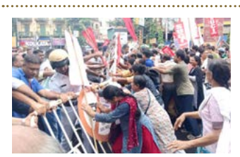
ആർ.ജി.കാർ: പിജി ഡോക്ടറുടെ കൊലപാതകം

എസ് യു സിഐ(സി) ആഹ്വാനം ചെയ്ത 12 മണിക്കൂർ ബംഗാൾ ബന്ദ് സമ്പൂർണ്ണം