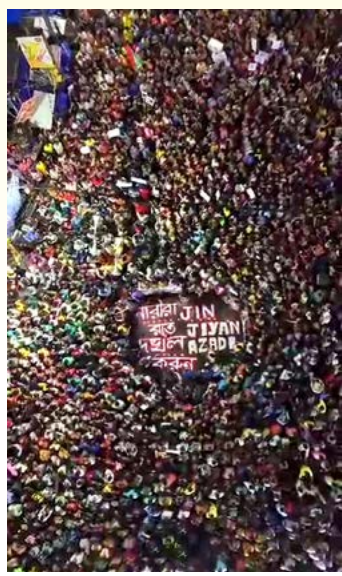
ആഗസ്റ്റ് 14 രാത്രിയിൽ കൽക്കത്ത നഗരത്തിൽ നടന്ന വനിതകളുടെ രാത്രി കൈയടക്കൽ സമരത്തിൽ തടിച്ചുകൂടിയ പ്രതിഷേധക്കാർ

ത്തിയ ഒരു സർവ്വേയുടെ റിപ്പോർട്ട്, എത്രമേൽ യോന്തരീക്ഷത്തിലാണ് ആരോഗ്യപ്രവർത്തകർ ജോലിയെടുക്കുന്നത് എന്ന് സൂചിപ്പിക്കുന്നു. റിപ്പോർട്ട് അനുസരിച്ച് 82 ശതമാനം ഡോക്ടർമാരും തൊഴിൽ രംഗത്ത് മാനസിക സമ്മർദ്ദം അനുഭവിക്കുന്നവരാണ്, 62 ശതമാനം പേർ ജോലിയിൽ അക്രമം ഉണ്ടായേക്കാം എന്ന് ഭയപ്പെടുന്നവരാണ്. ഡോക്ടർമാരും ആരോഗ്യപ്രവർത്തകരും നടത്തുന്ന സമരത്തെ പിന്തുണച്ചുകൊണ്ട് എസ് യു സി ഐ (കമ്മ്യൂണിസ്റ്റ്) പാർട്ടി ആഗസ്റ്റ് 17ന് പശ്ചിമബംഗാളിൽ പ്രഖ്യാപിച്ച ബന്ദിന് വമ്പിച്ച പിന്തുണയാണ് ലഭിച്ചത്. ബംഗാളിനെ നിയമലാക്കിക്കൊണ്ട് എല്ലാവിഭാഗം ജനങ്ങളും വഴിയോര കച്ചവടക്കാരും തൊഴിലാളികളുമടക്കം ബന്ദിന് ഐക്യദാർഢ്യം പ്രഖ്യാപിച്ചു. ഇനിമേൽ ഇത്തരം സംഭവങ്ങൾ ആവർത്തിക്കാതിരിക്കാൻ കൈവിട്ടുപോകാൻ സർക്കാരിന്റെ മേൽ സമ്മർദ്ദം ചെലുത്താനാകുന്ന അതിശക്തമായ ബഹുജനപ്രക്ഷോഭത്തിന്റെ പാതയിൽ അണിനിരക്കുവാൻ ഏവരോടും അഭ്യർത്ഥിക്കുന്നു.