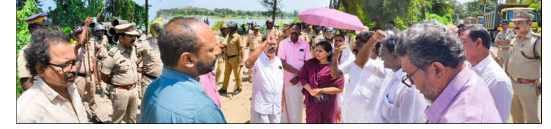
ആലപ്പുഴ തോട്ടങ്ങളിൽ നടക്കുന്ന കരിമണൽ ഖനനത്തിനെതിരെ പ്രതിഷേധിച്ച സമരസമിതി പ്രവർത്തകരെ പോലീസ് അറസ്റ്റ് ചെയ്ത് നീക്കുന്നു.