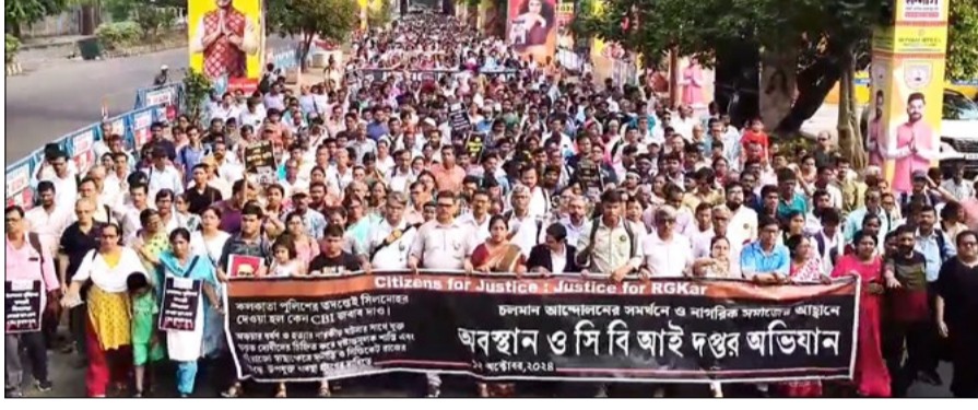
ആർജി കർ സംഭവത്തിൽ അന്വേഷണം ഉൾക്കൊള്ളിക്കപ്പെടാത്തതും കുറ്റവാളികളെ ഉടൻ പിടികൂടി കർശനമായി ശിക്ഷിക്കണമെന്നും ആവശ്യപ്പെട്ട് ജനകീയ സമിതിയുടെ നേതൃത്വത്തിൽ ഒക്ടോബർ 12ന് കൊൽക്കത്തയിൽ നടന്ന സിബിഐ ഓഫീസ് മാർച്ച്.

ആശുപത്രികളിൽ ഭീഷണിപ്പെടുത്തി എല്ലാ നിയന്ത്രിക്കുന്ന സംഘങ്ങളെ ഉടൻ അറസ്റ്റ് ചെയ്യണമെന്ന് അവർ ആവശ്യപ്പെട്ടു. ഇതിന് കാലതാമസം നേരിടുന്നപക്ഷം, ആരോഗ്യപ്രവർത്തകരുടെ സുരക്ഷയും, ആശുപത്രികളിൽ ജനാധിപത്യ അന്തരീക്ഷം പുനഃസ്ഥാപിക്കലും ഉറപ്പുവരുത്താൻ കഴിയില്ലെന്നും അവർ അഭിപ്രായപ്പെട്ടു. ഇക്കാര്യത്തിൽ കൃത്യമായ നടപടികൾ സർക്കാർ സ്വീകരിക്കാത്തതിനാൽ, ജൂനിയർ