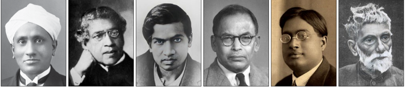
■ സി.വി.രാമൻ ■ ജെ.സി.ബോസ് ■ ശ്രീനിവാസ രാമാനുജൻ ■ മേഘനാഥ് സാഹ ■ സത്യേന്ദ്രനാഥ് ബോസ് ■ പി.സി.റേ

ന്റെ അലകും പിടിയും മാറ്റുന്നു. പ്രാഥമികതലം മുതൽ തൊഴിലധിഷ്ഠിതവിദ്യാഭ്യാസം ഏർപ്പെടുത്തി, കുട്ടികൾക്ക് അടിസ്ഥാനഭാഷാ, ഗണിത, ശാസ്ത്ര തത്വങ്ങൾ ഗ്രഹിക്കാനുള്ള അവസരം നഷ്ടപ്പെടുത്തുന്നു. സിലബസ് യുക്തിഭദ്രമാക്കുക എന്നുപറഞ്ഞ് ചരിത്രത്തിലെയും ശാസ്ത്രത്തിലെയും സുപ്രധാന ഭാഗങ്ങൾ പാഠ്യപുസ്തകത്തിൽ നിന്നൊഴിവാക്കുന്നു. സ്വാതന്ത്ര്യസമരനേതാക്കളെ, എന്തിന് ഗാന്ധിജിയെ വരെ പാഠ്യപുസ്തകങ്ങളിൽനിന്നു പുറത്താക്കുന്നു. നവോത്ഥാനം, ജനാധിപത്യം തുടങ്ങിയവയെ ഒന്നിച്ചുള്ള പാഠങ്ങൾ ഇല്ലാതാക്കുന്നു. സ്കൂൾതലത്തിൽത്തന്നെ എല്ലാ വിദ്യാർത്ഥികളും പഠിച്ചിരിക്കേണ്ട പരിണാമസിദ്ധാന്തം ഹയർ സെക്കണ്ടറി തലത്തിൽ ജീവശാസ്ത്രം പഠിക്കുന്നവർക്കു മാത്രമാക്കി ചുരുക്കുന്നു. അതു തന്നെ അപ്രസക്തമായ വിധത്തിലും. ജീവജാലങ്ങൾ മാത്രമല്ല ഈ പ്രപഞ്ചം തന്നെ പരിണമിച്ചുകൊണ്ടിരിക്കുകയാണെന്ന അടിസ്ഥാനധാരണ കട്ടികളിലുറപ്പിക്കുന്നതിൽ പരിണാമസിദ്ധാന്തത്തിന്റെ പഠനത്തിന് വലിയ പങ്കുണ്ട്. അതവർക്കു നിഷേധിക്കുന്നു. രസതന്ത്രത്തിലെ ആവർത്തനപ്പട്ടികയും പാഠ്യപുസ്തകത്തിൽ പുറത്താക്കുന്നു. എല്ലാ പദാർത്ഥങ്ങളുടെയും അടിസ്ഥാന ചേരുവകളായി മൂലകങ്ങൾ ഉണ്ടെന്നുള്ളതും ആ മൂലകങ്ങൾ തന്നെ തുടർച്ചയായ ഒരു ശ്രേണിയിലെ അംഗങ്ങൾ ആണെന്നുള്ളതും അവയുടെ രാസ, ഭൗതിക ഗുണങ്ങൾ ആ ശ്രേണിയിലെ സ്ഥാനത്തിന്റെ ധർമ്മമാണെന്നും മനസ്സിലാക്കുന്നത് ആവർത്തനപ്പട്ടികയുടെ പഠനത്തിലൂടെയാണ്. പ്രപഞ്ചത്തിന്റെ അടിസ്ഥാനഘടനയെക്കുറിച്ച് കുട്ടികൾക്ക് ഒരു ധാരണ നൽകുന്നതാണ് ആവർത്തനപ്പട്ടിക. ഇത് ഇന്നത്തെ സാമാന്യ ബോധത്തിന്റെ ഭാഗമായി മാറേണ്ട അടിസ്ഥാനവസ്തുതയാണ്. അങ്ങനെ ശാസ്ത്രീയധാര