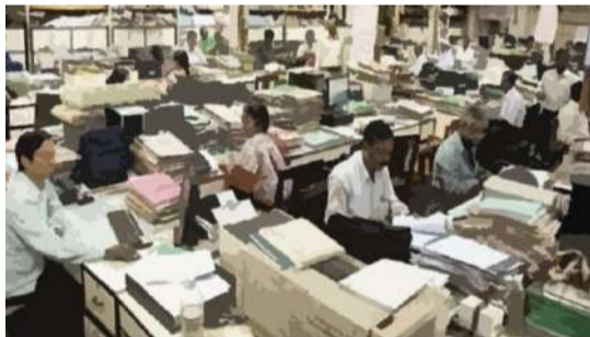
സങ്കല്പത്തിന്റെ ഭാഗമാണ് പെൻഷനും. മാത്രമല്ല, അവരുടെ കൈവശമെത്തുന്ന പണം പൊതുവിപണിയെ കൂടുതൽ സജീവമാക്കുന്നുണ്ട്. രാജ്യത്തെ ജനസംഖ്യയിൽ വൃദ്ധരുടെ