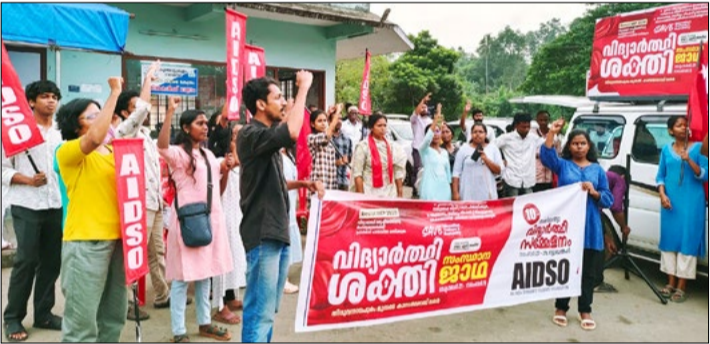
വിദ്യാർത്ഥിശക്തി ജാഥയ്ക്ക് കൂത്താട്ടുകുളത്ത് നൽകിയ സ്വീകരണം.