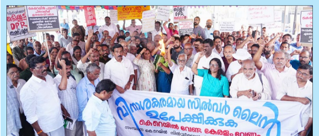
വിനാശ പദ്ധതി സിൽവർ ലൈൻ പിൻവലിക്കണം എന്നാവശ്യപ്പെട്ടുകൊണ്ട് കൈരയിൽ സിൽവർ ലൈൻ വിരുദ്ധ ജനകീയ സമിതി ആലുവയിൽ നടത്തിയ പ്രതിരോധ സംഗമത്തിൽ ഉയർത്തിയ സമരമുന്നോട്ടുചാല. വാർത്ത 11-ാം പേജിൽ