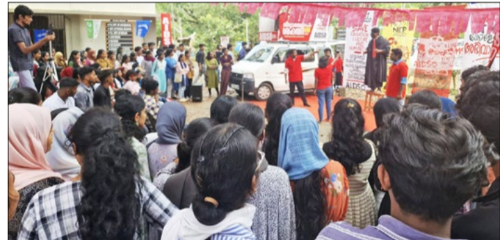
വിദ്യാർത്ഥിശക്തി ജാഥയുടെ ഭാഗമായി തിരൂർ തുഞ്ചൻ മെമ്മോറിയൽ ഗവൺമെന്റ് കോളേജിൽ തെരുവുനാടകം അവതരിപ്പിക്കുന്നു.

കൾക്ക് അടിയറ വെയ്ക്കുന്ന സംസ്ഥാന സർക്കാരിന്റെ നടപടികൾ വിശദീകരിച്ചുകൊണ്ട് നടന്ന ജാഥയ്ക്ക് കാമ്പസുകളിൽ നിന്നും പൊതുജനങ്ങളിൽ നിന്നും ഹാർദ്ദമായ സ്വീകരണം ലഭിച്ചു. നാലു വർഷ ഡിഗ്രി നടപ്പിലാക്കിക്കൊണ്ട്, എല്ലാ സർവകലാശാലകളിലും ഭീമമായ ഹീസ് വർദ്ധനവ് നടപ്പിലാക്കുമ്പോൾ നിശബ്ദത വെടിഞ്ഞ് സമരരംഗത്ത് അണിനിരക്കുകയെന്ന വിദ്യാർത്ഥി ശക്തി ജാഥയുടെ സന്ദേശം ജനാധിപത്യ വിശ്വാസികൾ തുറന്ന മനസ്സോടെ സ്വീകരിച്ചു. ദേശീയ വിദ്യാഭ്യാസ നയം 2020 നടപ്പിലാക്കുന്ന പിണറായി സർക്കാരിന്റെ കച്ചവട താൽപര്യത്തിനെതിരെ വിദ്യാഭ്യാസ സ്നേഹികളെ ഒന്നിപ്പിച്ചുകൊണ്ട്, ഒരു വിദ്യാഭ്യാസ സംരക്ഷണ പ്രസ്ഥാനം